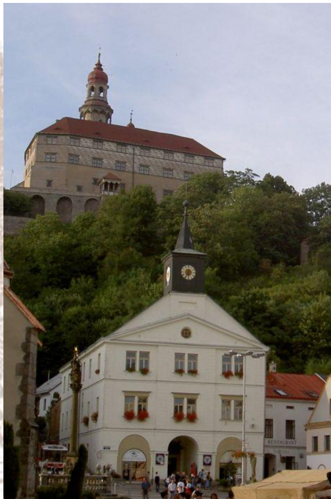
Замок в Находе.