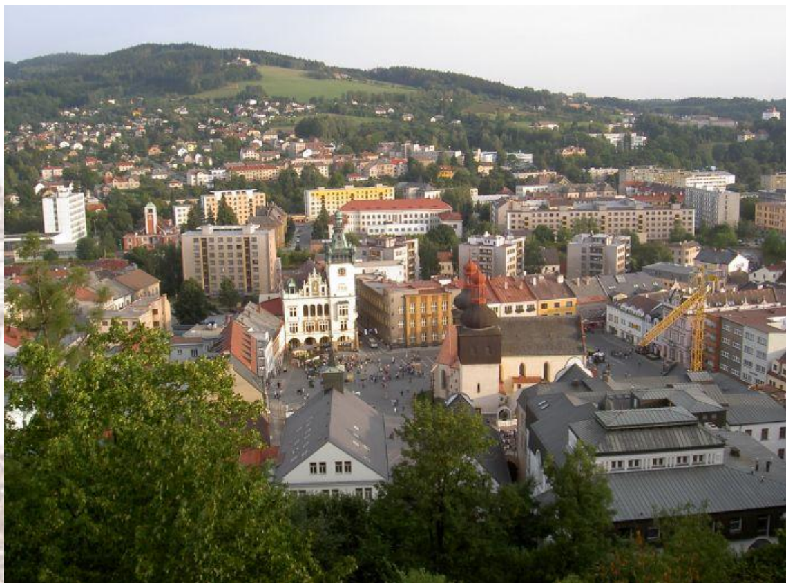
Панорама города Наход.