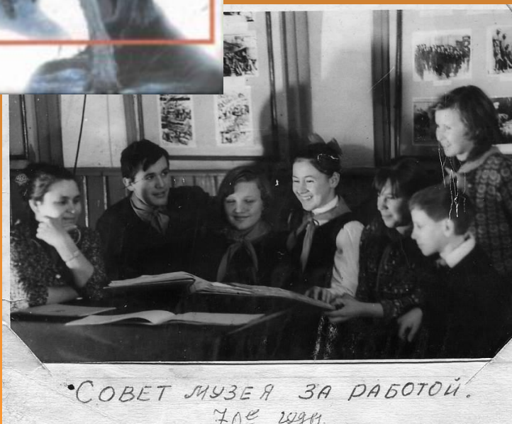
• СОВЕТ МУЗЕЯ ЗА РАБОТОЙ. 70е гг.