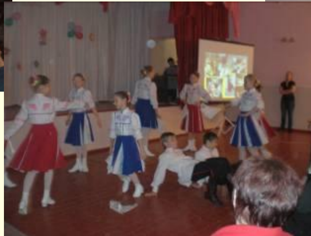
Концерт для родителей