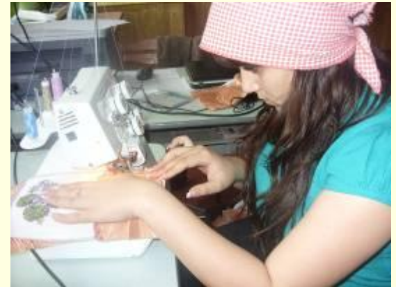
Изготовление в подарок кисетов для ветеранов ВОВ к 9.05.11г.