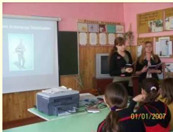
Жанр поэзии, история, ОПК