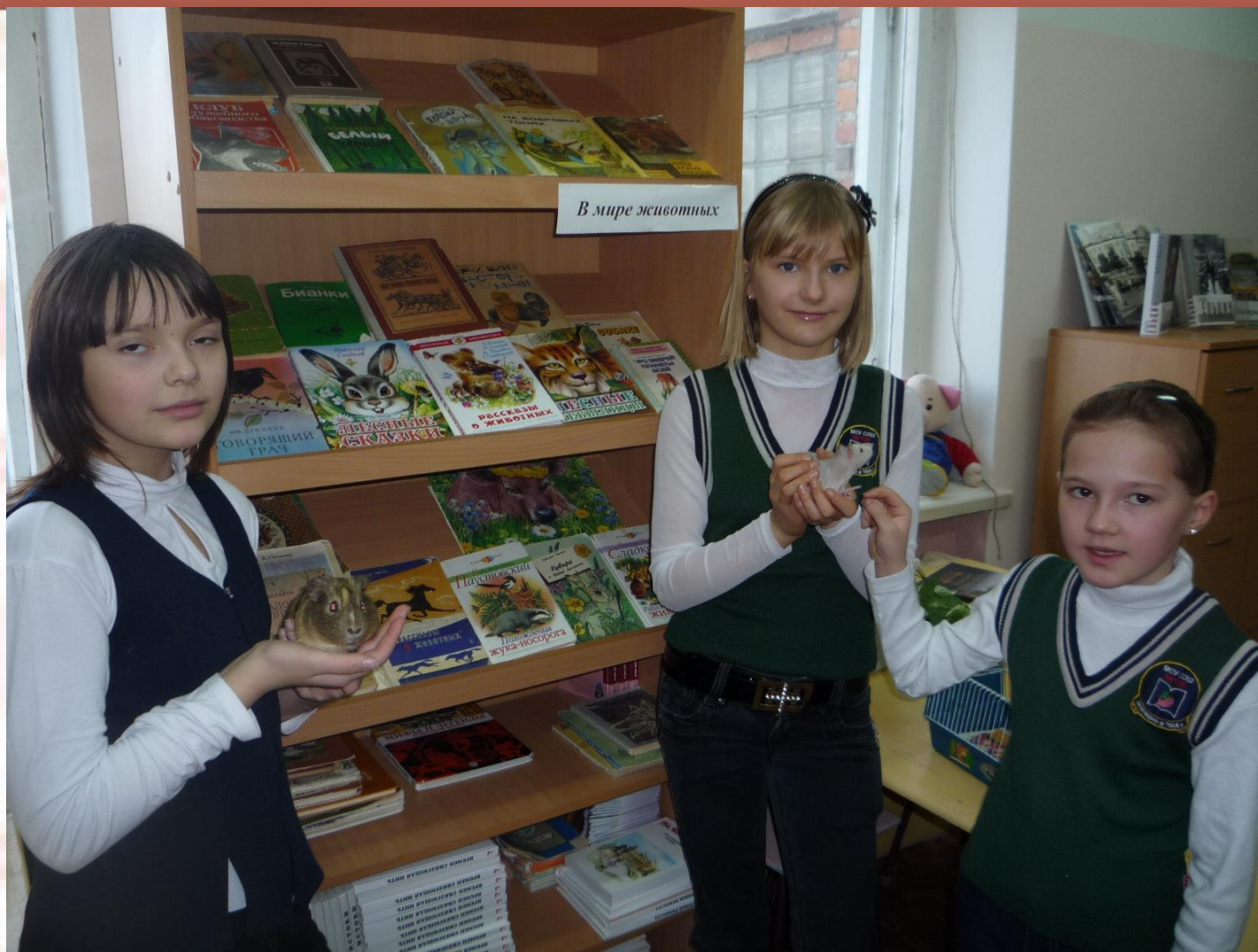
Стивен ( морская свинка) и Жора (крысенок) с хозяйками в гостях библиотеки