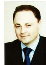
Организаторы автопробега «Владивосток АТЭС-2012»