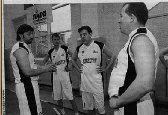
Команда «Известий»: МИНУТА НА РАЗМЫШЛЕНИЕ

Нынешний турнир проходил под девизом «Мы помним».