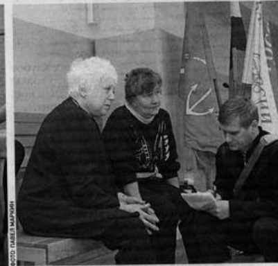
Матери всегда живут надеждой