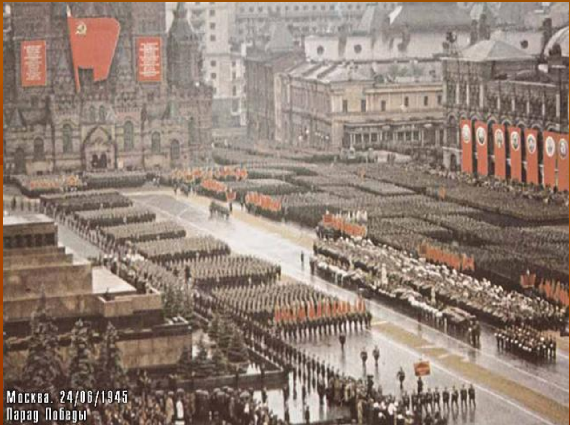
Москва. 24/06/1945 Парад Победы