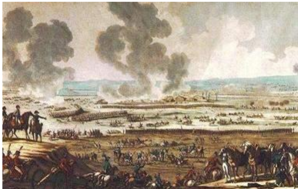
Битва при Аустерлице