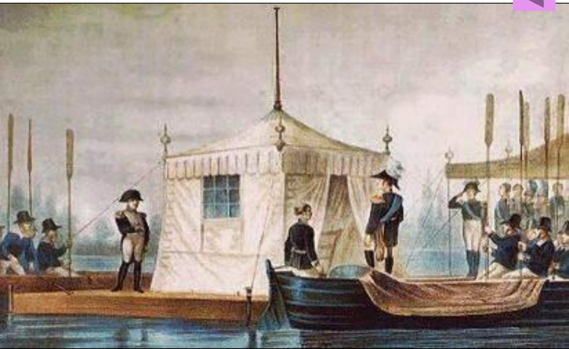
Подписание Тильзитского мира.