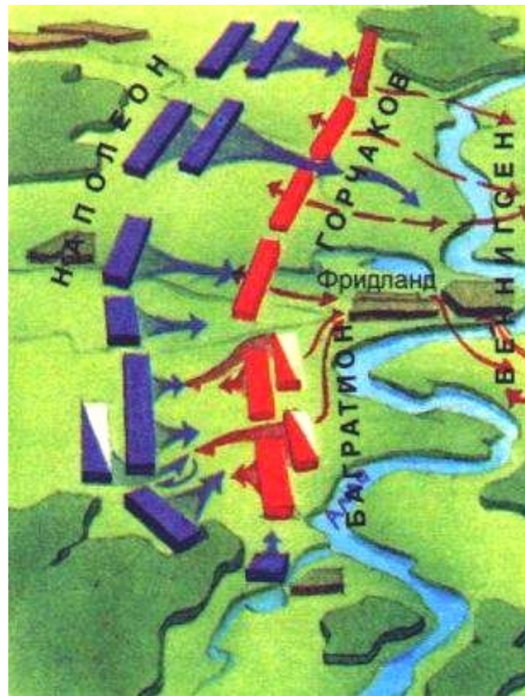
Битва под Фридландом