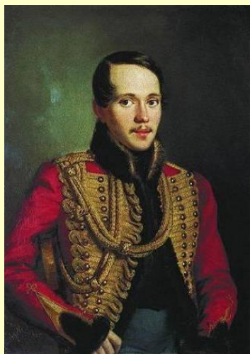
Петр Заболотский Портрет М.Ю.Лермонтова 1827 г.

Возвращаясь на Кавказ, Лермонтов задерживается в Пятигорске для лечения на минеральных водах. Случайная ссора с соучеником по юнкерской школе Н. С. Мартыновым приводит к "вечно печальной дуэли" и гибели поэта