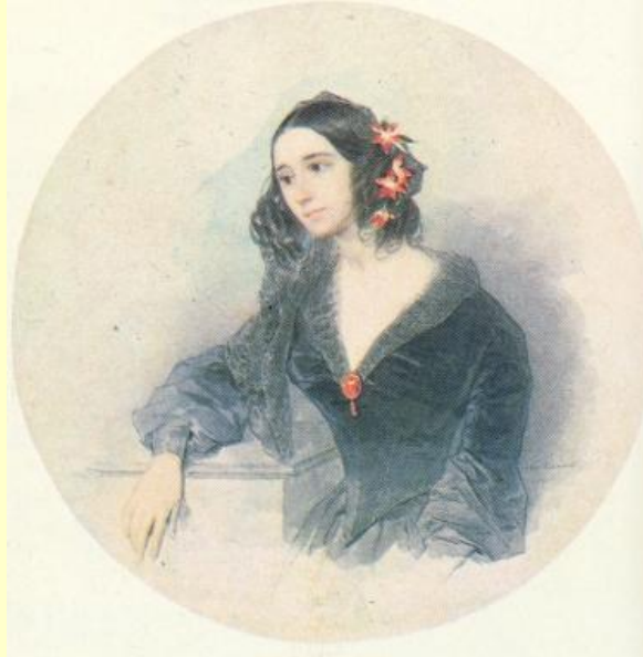
Евдокия Петровна Ростопчина (ур. Сушкова) (1811-58)