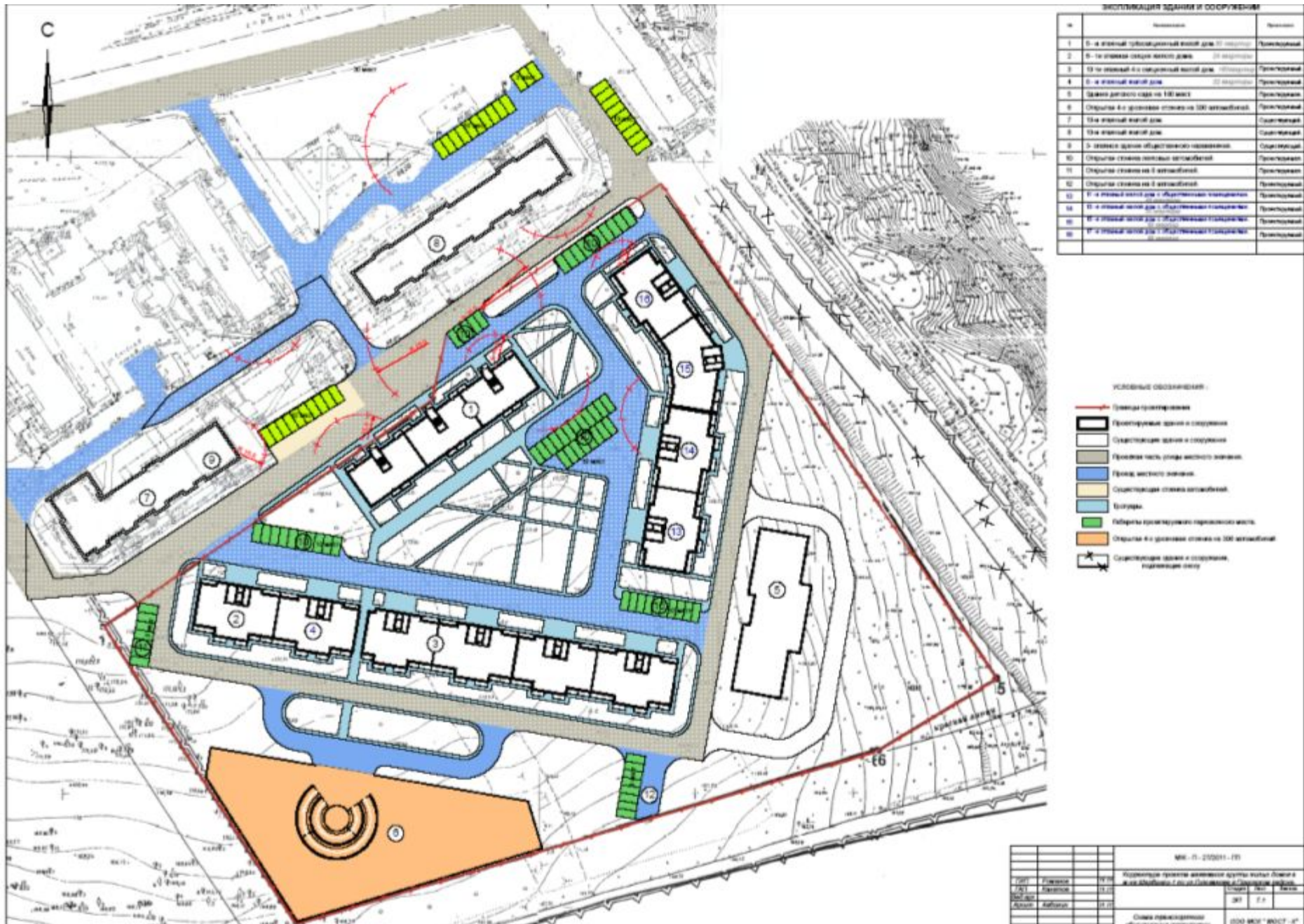
Схема транспортного обслуживания территории