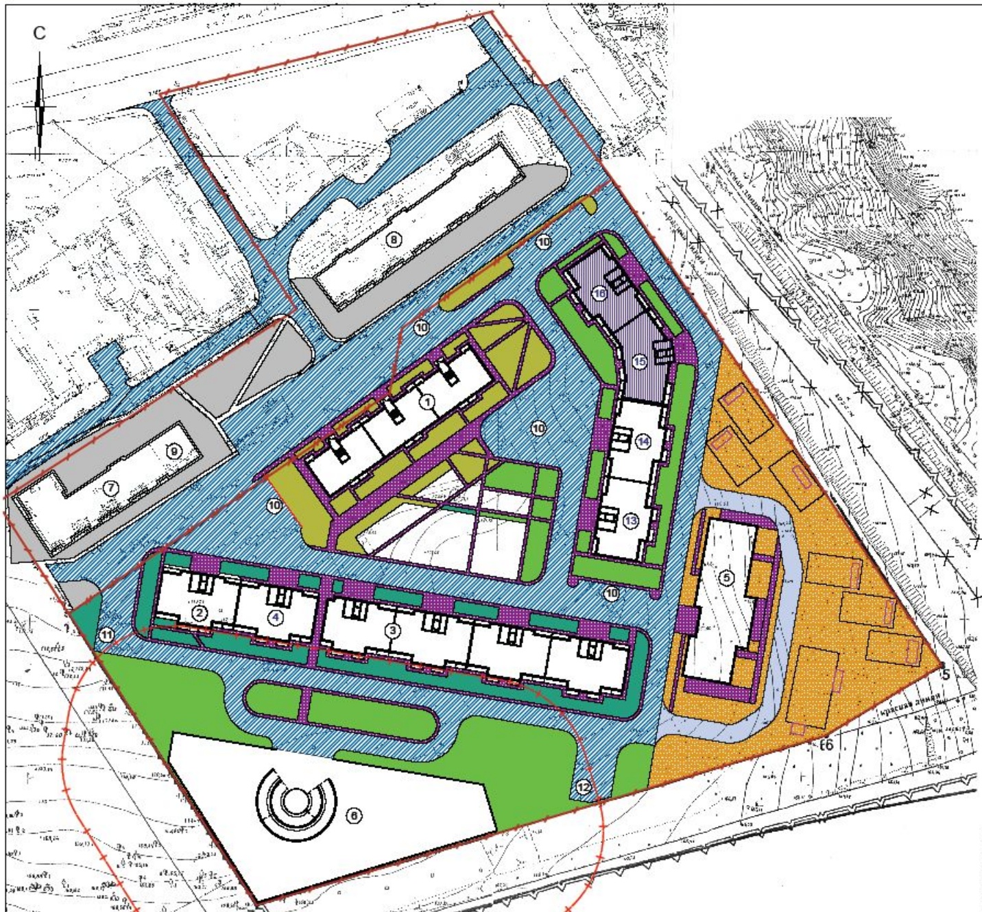
Ситуационный план М 1:10000