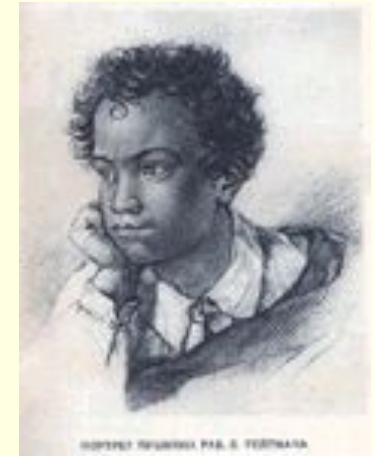
А.С. Пушкин. Портрет работы Е.И. Гейтмана. 1822 г.