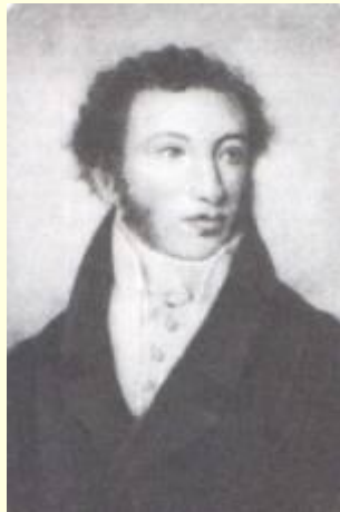
А.С. Пушкин Работа И.Е. Вивьена. 1826г.