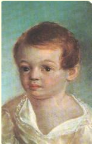
Пушкин Неизвестный художник. Миниатюра. 1801-1802 гг.