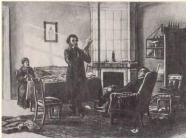
Н.Н. Ге «Пушин в гостях у Пушкина в Михайловском»