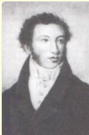
А.С. Пушкин Работа И.Е. Вивьена. 1826г.