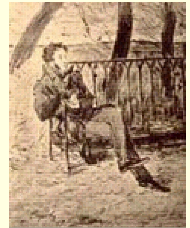
В.А. Серов «Пушкин на садовой скамье»