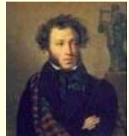
Портрет работы О. А. Кипренского. 1827 г