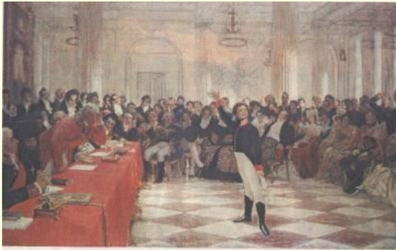
Репин «Пушкин на лицейском экзамене»