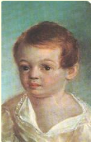
Пушкин Александр Сергеевич художник. Миниатюра. 1801-1802 гг.