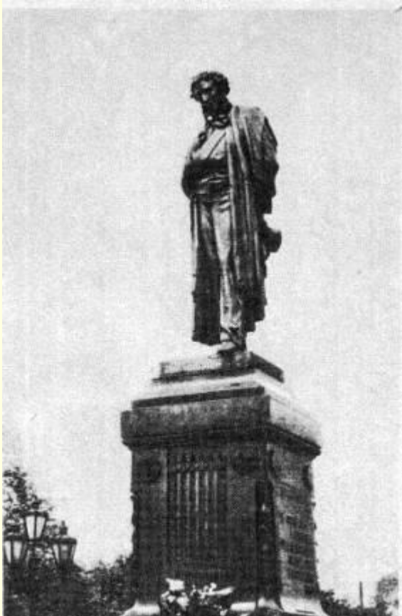
Скульптура А.М. Опекушина «Памятник»