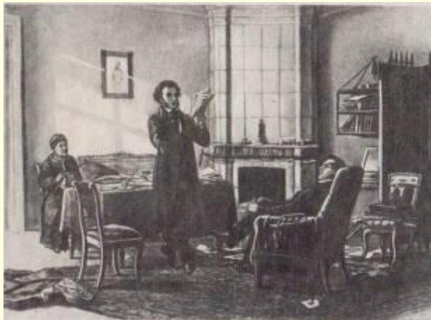
Н.Н. Ге «Пушин в гостях у Пушкина в Михайловском»