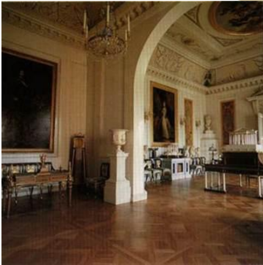
Малый кабинет Павла I.