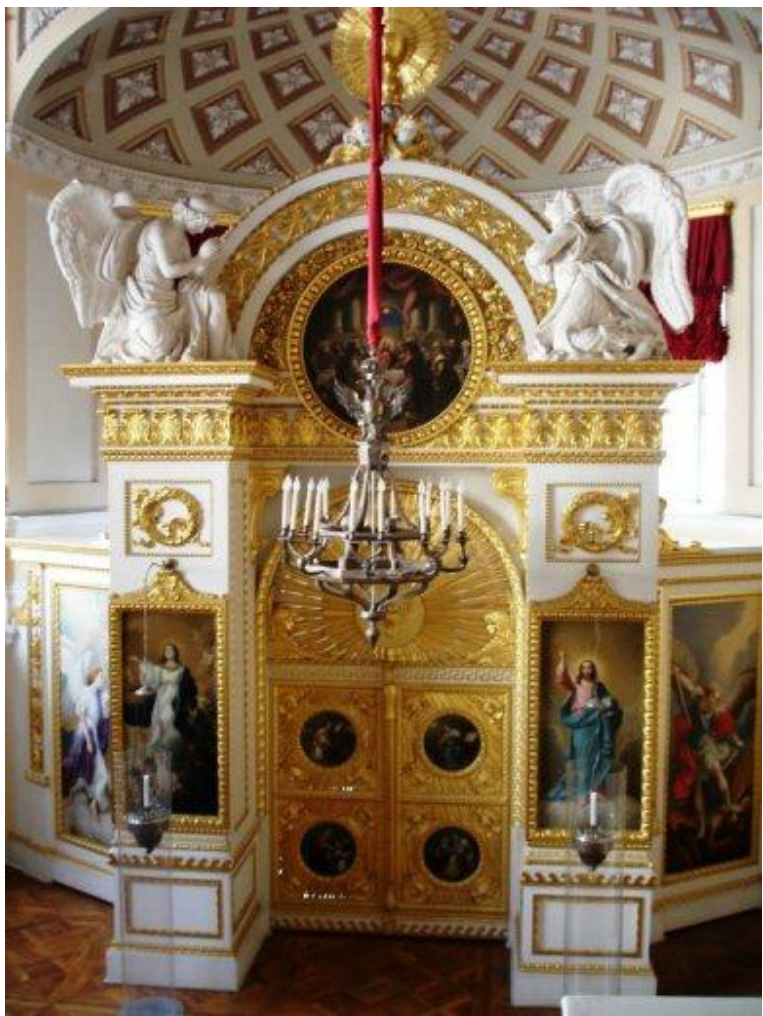
Церковь Петра и Павла в Павловском дворце.