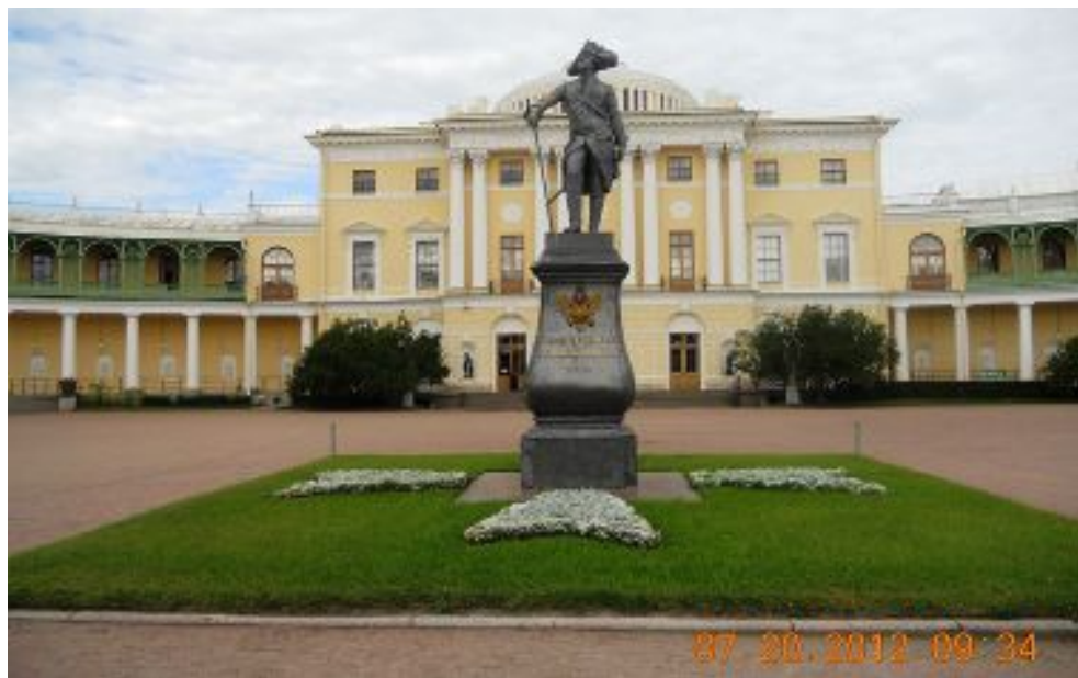
Памятник Павлу и Павловский дворец.

Загородная поездка в музей-заповедник «Павловск» - выдающийся дворцово-парковый ансамбль конца XVIII - начала XIX вв., летнюю резиденцию императора Павла I и его семьи.