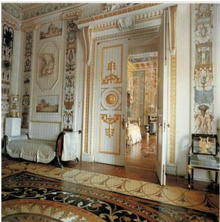
Павловский дворец. Будуар.