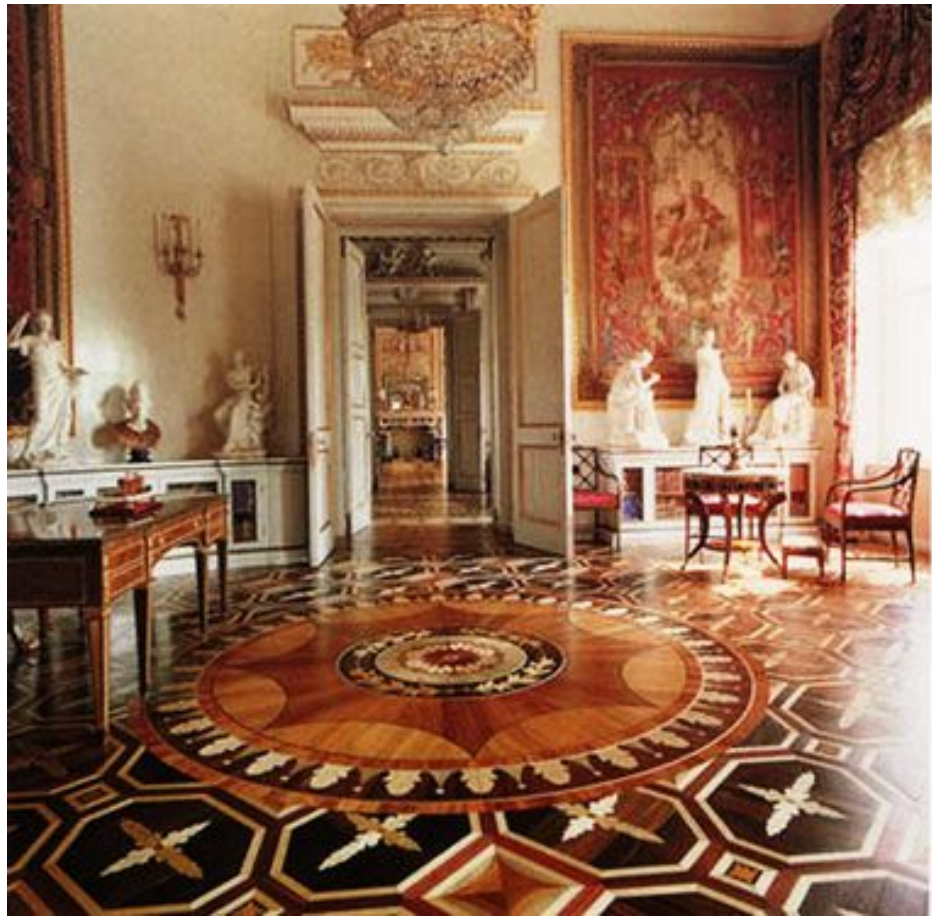
Библиотека Марии Фёдоровны.