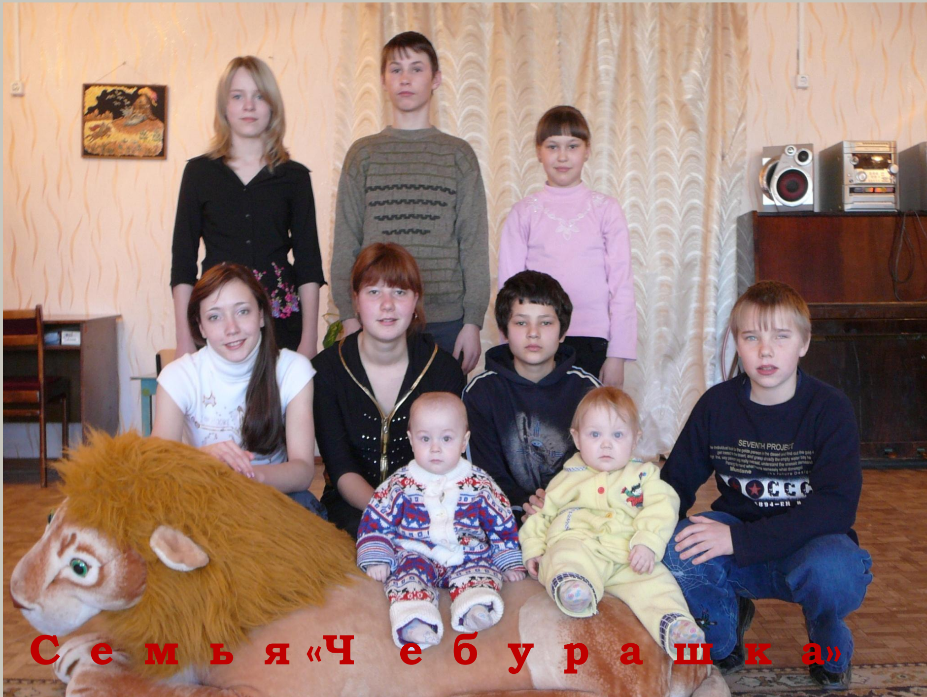
С е м ь я «Ч е б у р а ш к а»