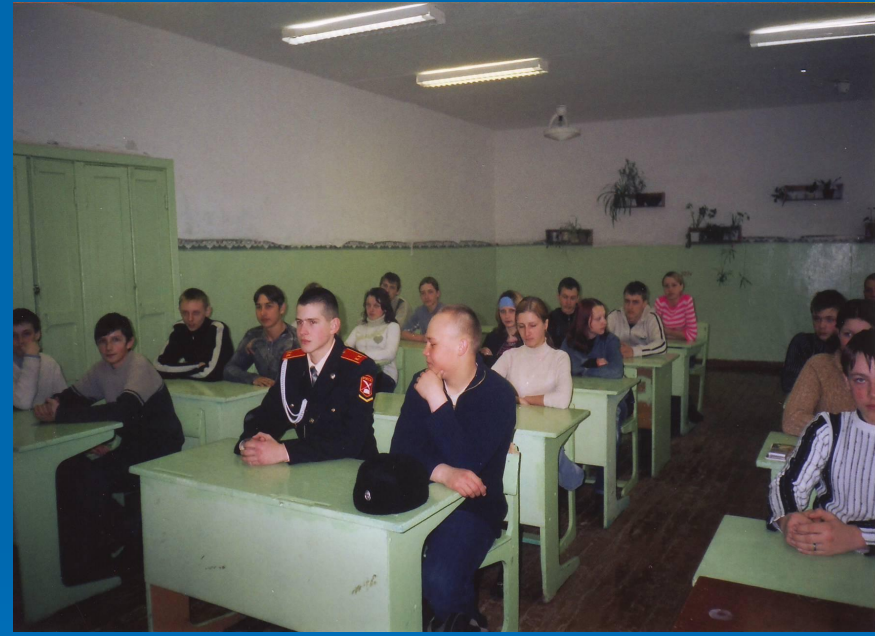
Классный час «Мой друг, Отчизне посвятим души прекрасные порывы»