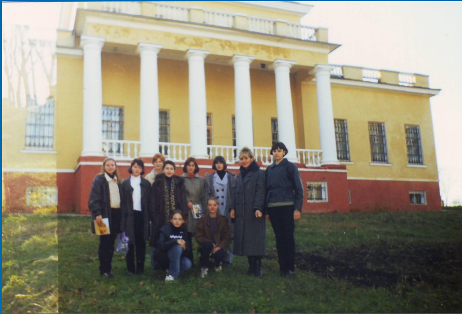
Экскурсия в Овстуг