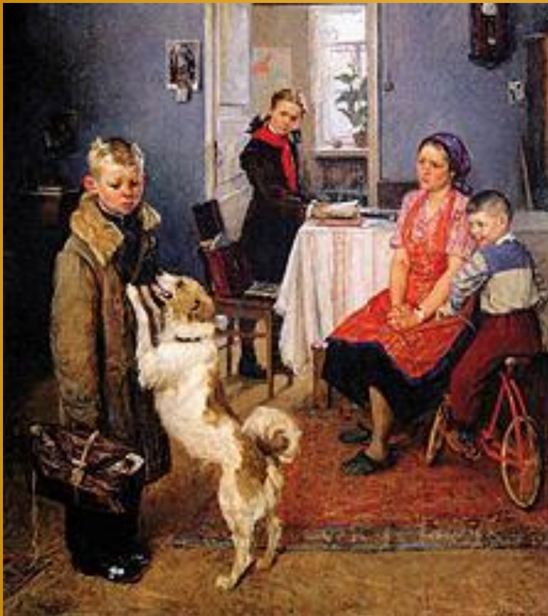
Ф.П.Решетников "Опять двойка".