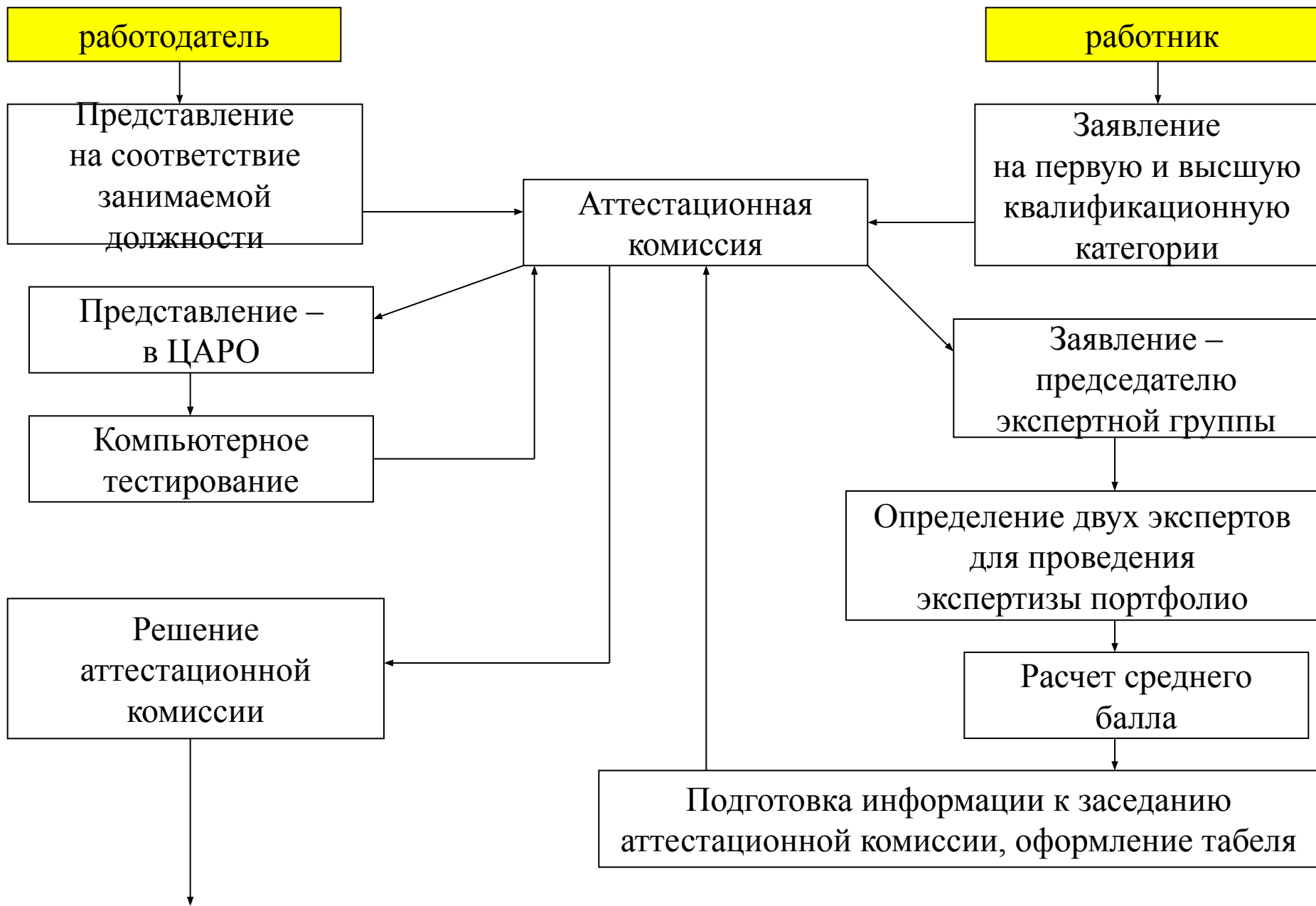
Схема проведения аттестации педагогических работников