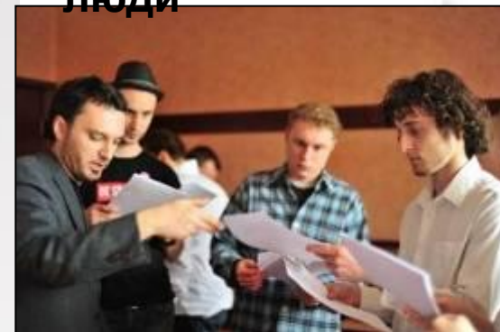
Брифинг команды игротехнической