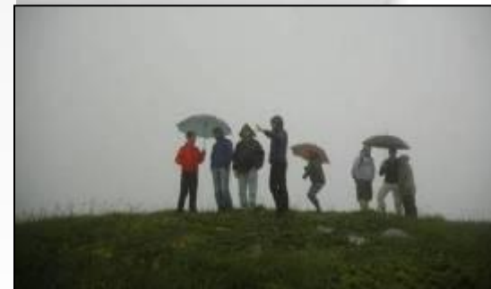
Менеджеры компании «Мы» и черногорских компаний Meridian и Explorer – внутри облака на высоте 2000 метров во время подготовки мероприятия.