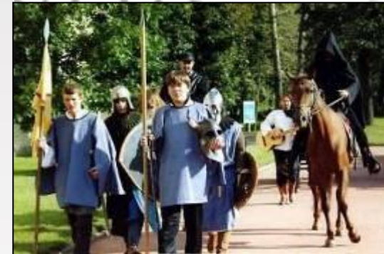
2004 год. Игра-приключение компании «Сталкер» с полным погружением в эпоху «Осень Средневековья»

Многолетние наработки в сфере организации специальных мероприятий, высокий уровень подготовки специалистов компании, индивидуальный подход к каждому проекту были высоко оценены не только нашими клиентами. В сентябре 2011 года «Агентство смелых решений «Мы» вошло в число пяти event агентств, сертифицированных АКМР (Ассоциацией директоров по коммуникациям и корпоративным медиа России). Специалисты компании приглашены для чтения авторских курсов по MICE и event в «Школу Сергея Князева».