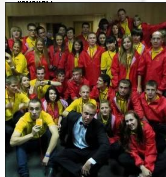
Часть команды аниматоров на конференции Faberlic