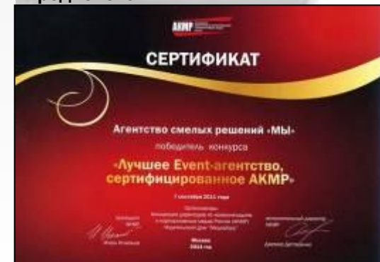
Сертификат АКМР, 2011 год