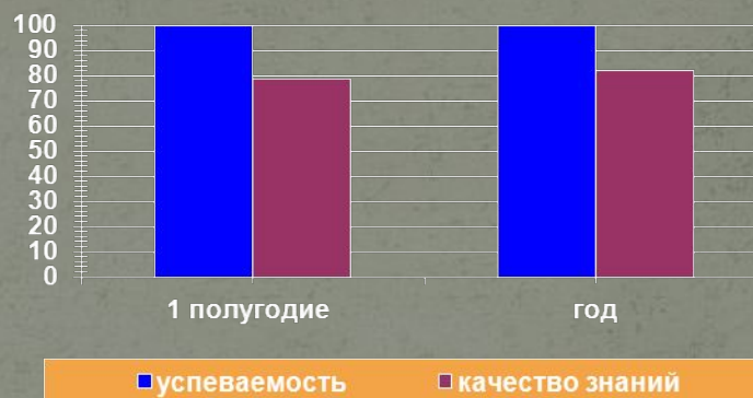
Успеваемость и качество знаний 2010 - 2011 учебный год