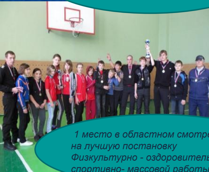
1 место в областном смотре-конкурсе на лучшую постановку Физкультурно - оздоровительной и спортивно- массовой работы среди ОУ