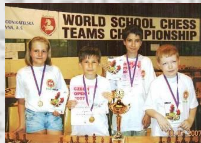
Победители чемпионата мира