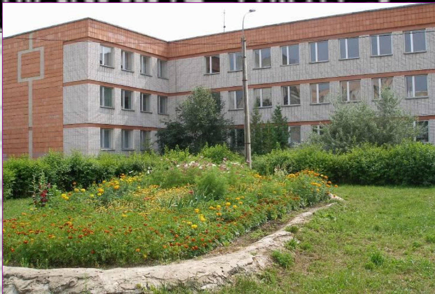
Гимназия № 6 Приволжского района г. Казани