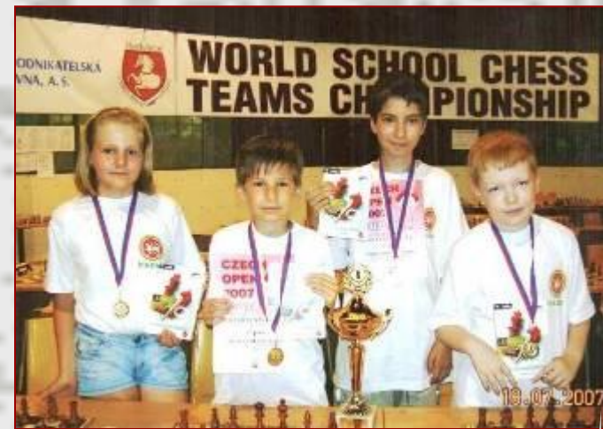
Победители чемпионата мира