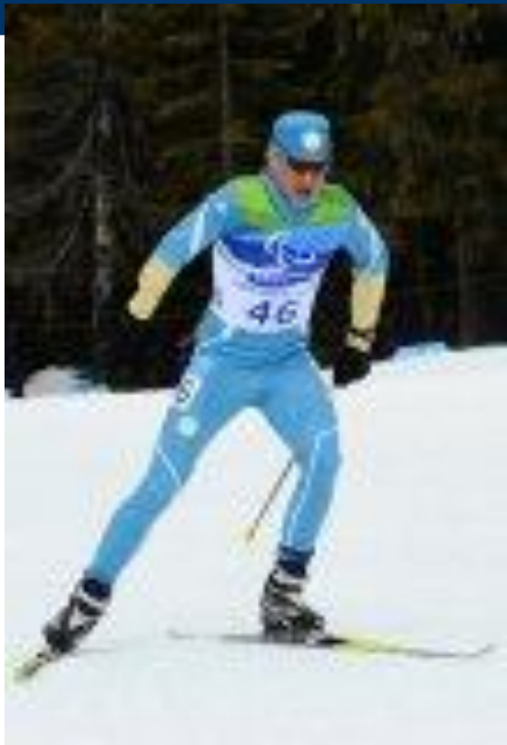
Украинский спортсмен, призёр Паралимпийских игр в Ванкувере.