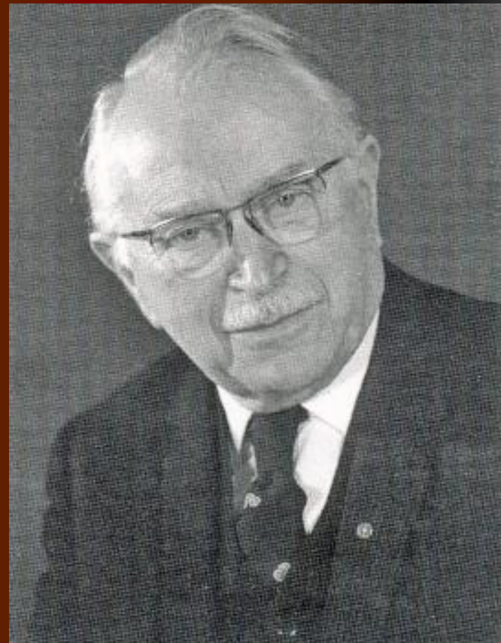
Людвиг Гуттман - отец Паралимпийских игр

Возникновение видов спорта, в которых могут участвовать инвалиды, связывают с именем английского нейрохирурга Людвига Гуттмана, который, преодолевая вековые стереотипы по отношению к людям с физическими недостатками, ввел спорт в процесс реабилитации больных с повреждениями спинного мозга. Он на практике доказал, что спорт для людей с физическими недостатками создает условия для успешной жизнедеятельности, восстанавливает психическое равновесие, позволяет вернуться к полноценной жизни независимо от физических недостатков.