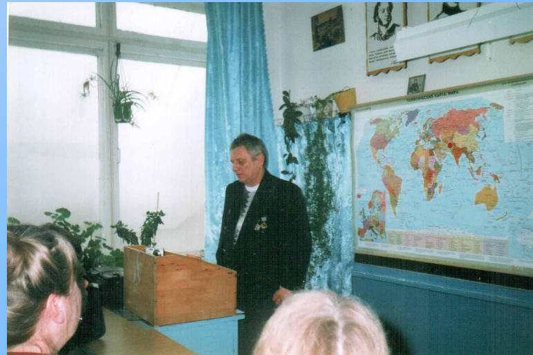
На встрече с учащимися и учителями