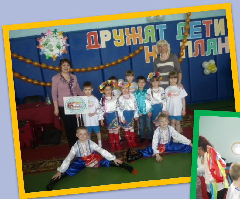
«Дружат дети на