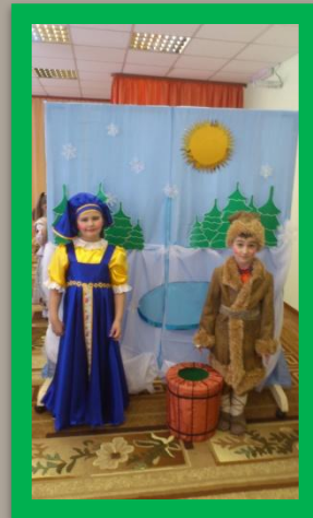
Фестиваль «Мир ярких и удивительных образов»