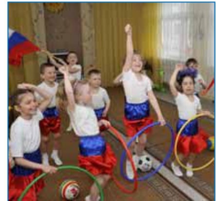
Реализация проекта «Велотур по Сахалину», спортивный праздник в детском саду «Сказка» в г. Холмске