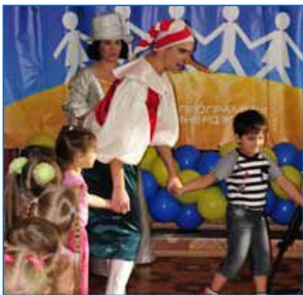
Реализация программы «Книжки в подарок» в детском саду «Одуванчик»

Программа "Спешите делать добро" действует в компании с 2003 года.