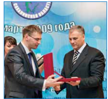
Церемония награждения победителей областного конкурса «Благотворитель года – 2009»