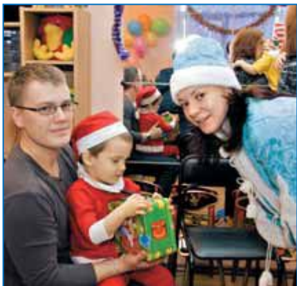
Новогодний праздник в центре реабилитации детей-инвалидов «Преодоление»