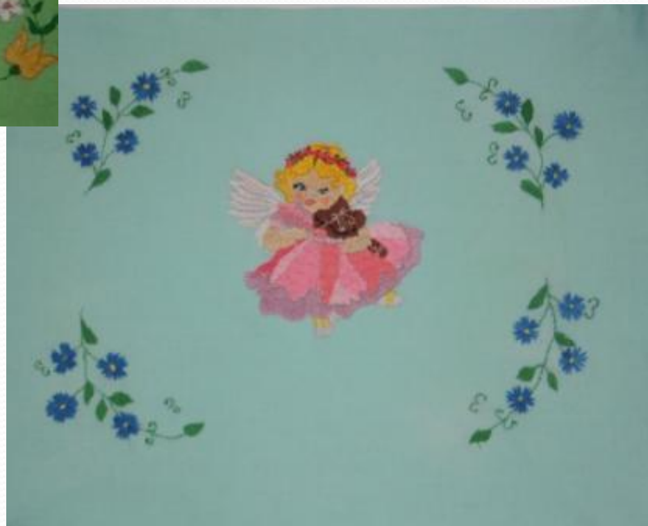
Вышивка Художественная гладь