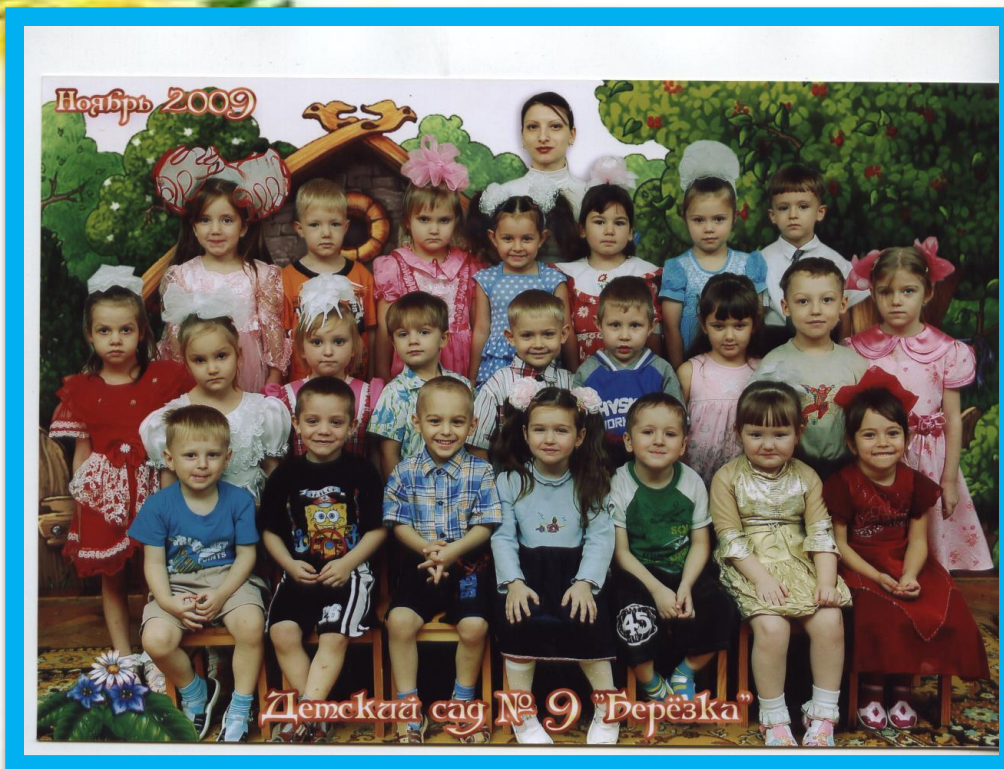
Старшая группа «Почемучки»