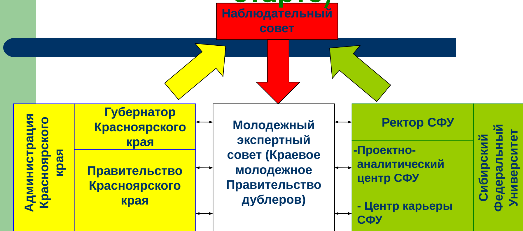
Схема взаимодействия (на старте)