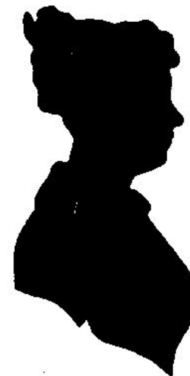
АННА Н. ВУЛЬФ. Силуэт неизвестного художника. 1820-е г

Я был свидетелем златой твоей весны; Тогда напрасен ум, искусства не нужны, И самой красоте семнадцать лет замена... От милых прежних прав заране откажись, Ищи других побед - успехи пред тобою,