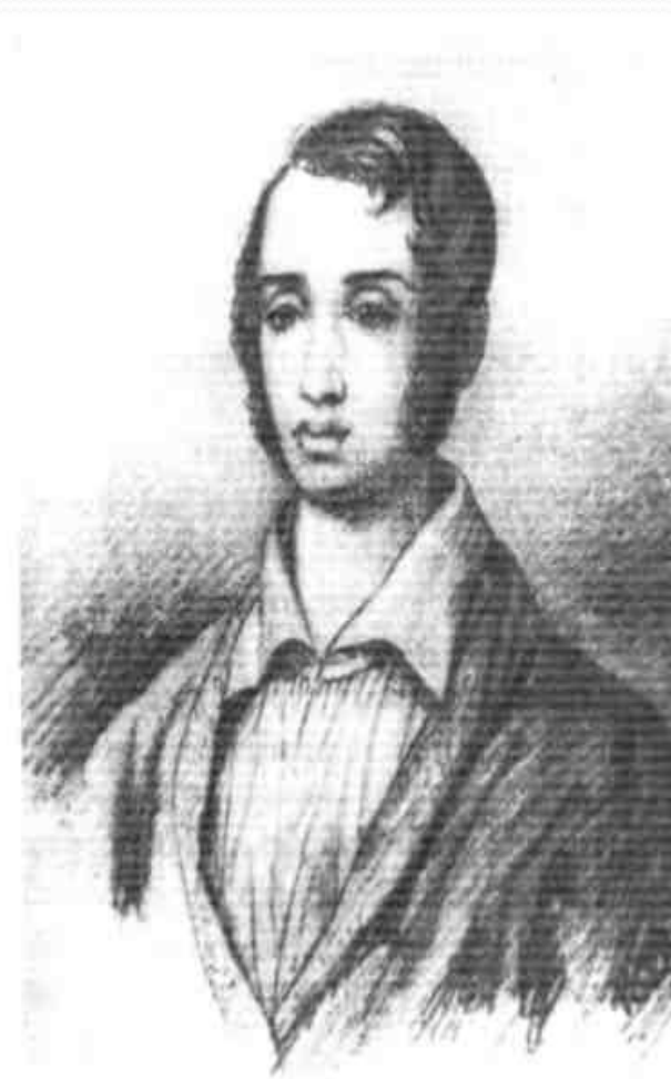
АЛЕКСЕЙ Н. ВУЛЬФ. Акварель А. И. Григорьева. 1828.

Пушкин читал Вульфу свои произведения и посвящал его в творческие замыслы. Из дневника Вульфа мы узнаем о работе поэта над «Арапом Петра Великого», «Полтавой», главами «Евгения Онегина», запиской «О народном воспитании». Пушкин делился с ним своими взглядами на современное состояние России, николаевскую цензуру.