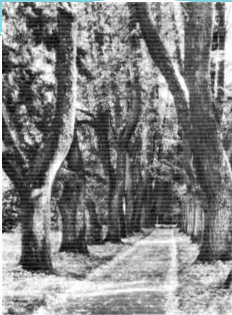
СЕЛО МИХАЙЛОВСКОЕ. ЛИПОВАЯ АЛЛЕЯ В ПАРКЕ (АЛЛЕЯ КЕРН). Фотография.