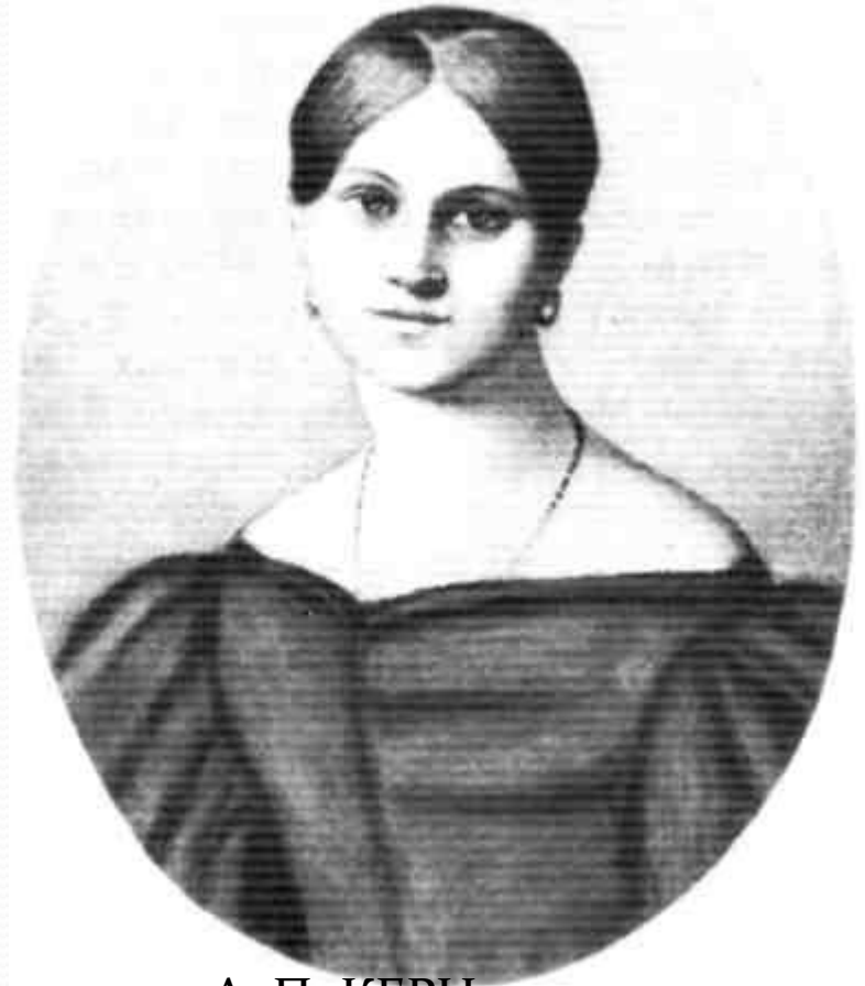
А. П. КЕРН. Миниатюра неизвестного художника. 1820-е годы.