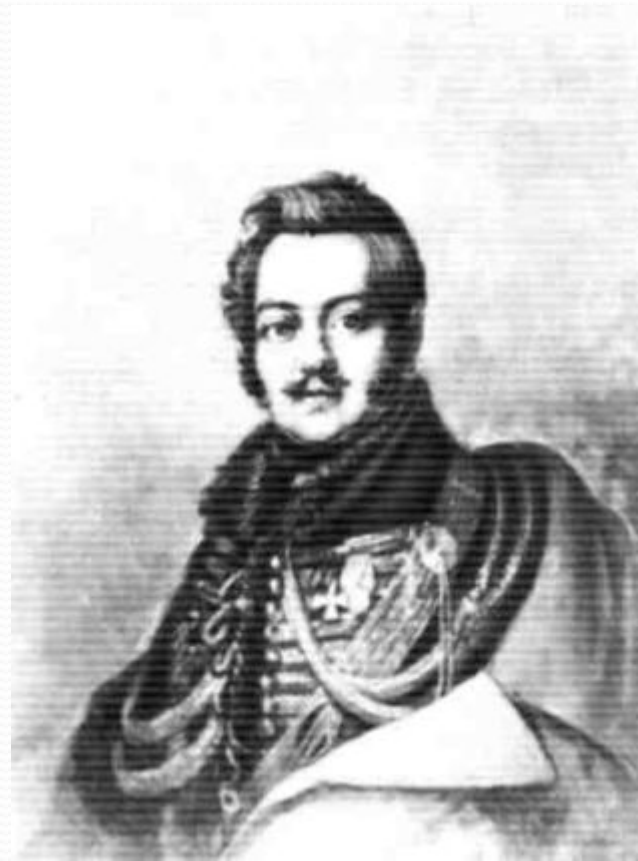
Д. В. ДАВЫДОВ. Д. Дау. Масло. Начало 1820-х годов.

Так воспринимал молодой Пушкин «гусарскую» лирику Давыдова, яркую и эмоциональную, навеянную патриотическим пафосом Отечественной войны 1812 года, одним из героев которой он был. Позднее Пушкин признавал, что он не сделался подражателем Батюшкова и Жуковского благодаря Давыдову, который «дал ему почувствовать еще в Лицее возможность быть оригинальным».