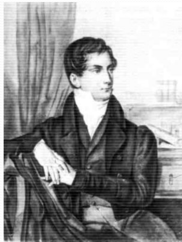
Д. В. ВЕНЕВИТИНОВ. А. Ф. Лагрене. Масло. 1826.

Еще до их личного знакомства Пушкин читал в «Сыне Отечества» (1825) отзыв Веневитинова о первой главе «Онегина» и так оценил его: «Это единственная статья, которую я прочел с любовью и вниманием». Был доволен Пушкин и его отзывами о второй главе «Онегина» и отрывке из «Бориса Годунова» (1826-1827).