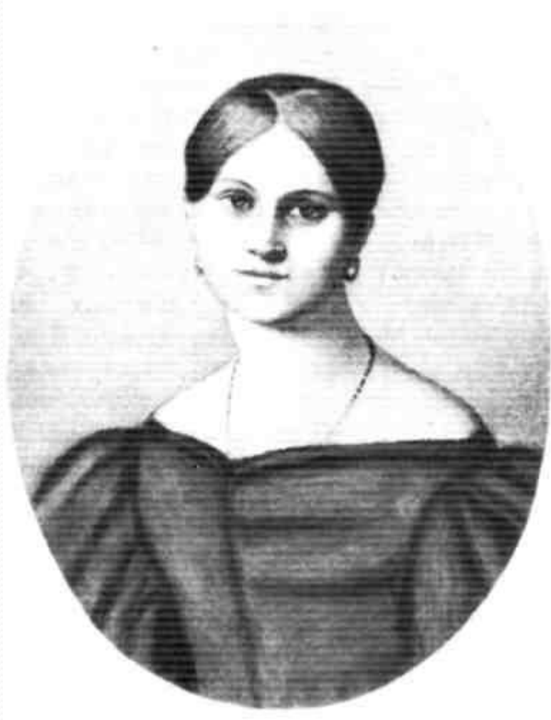
А. П. КЕРН. Миниатюра неизвестного художника. 1820-е годы.

Ранней весной 1819 года Анна Петровна приехала в Петербург и в доме ее родственников Олениных познакомилась с девятнадцатилетним Пушкиным. Юная красавица произвела на поэта неизгладимое впечатление. В стихотворении, посвященном Керн, отразилось это кратковременное знакомство и позднейшие их встречи.