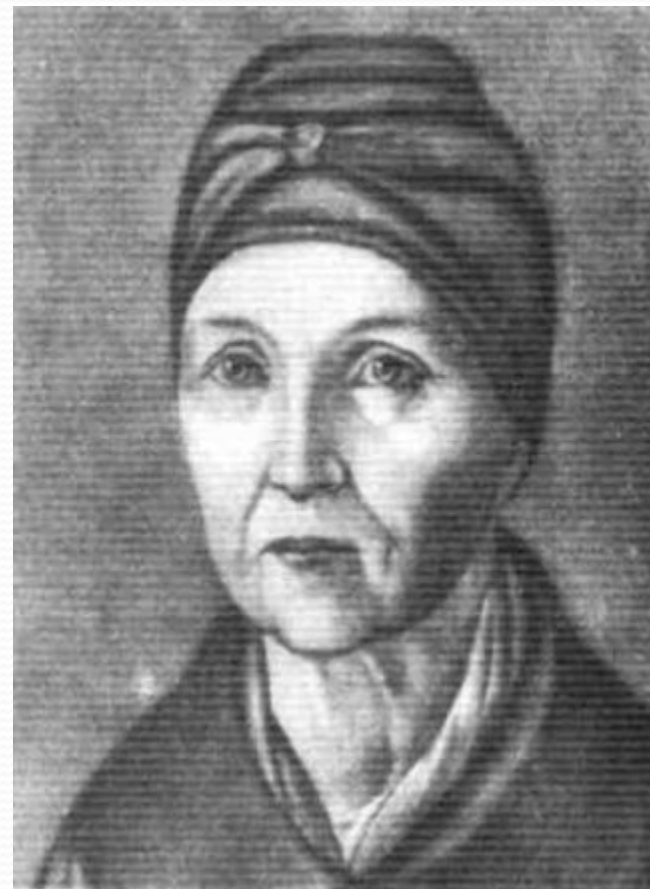
А. Р. ЯКОВЛЕВА. Неизвестный художник. Масло.

Живой образ Арины Родионовны запечатлен в стихотворениях «Зимний вечер» (1825), «Подруга дней моих суровых» (1826) и «Вновь я посетил тот уголок земли» (1835), а также в «Евгении Онегине» и «Дубровском».