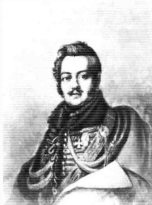
Д. В. ДАВЫДОВ. Д. Дау. Масло. Начало 1820-х годов.

Так воспринимал молодой Пушкин «гусарскую» лирику Давыдова, яркую и эмоциональную, навеянную патриотическим пафосом Отечественной войны 1812 года, одним из героев которой он был. Позднее Пушкин признавал, что он не сделался подражателем Батюшкова и Жуковского благодаря Давыдову, который «дал ему почувствовать еще в Лицее возможность быть оригинальным».