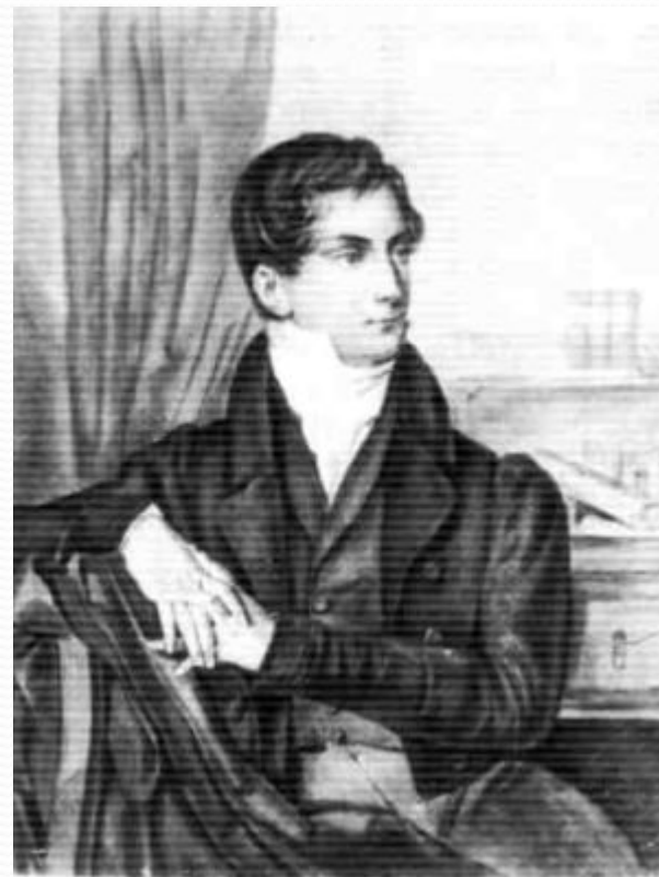
Д. В. ВЕНЕВИТИНОВ. А. Ф. Лагрене. Масло. 1826.

Еще до их личного знакомства Пушкин читал в «Сыне Отечества» (1825) отзыв Веневитинова о первой главе «Онегина» и так оценил его: «Это единственная статья, которую я прочел с любовью и вниманием». Был доволен Пушкин и его отзывами о второй главе «Онегина» и отрывке из «Бориса Годунова» (1826-1827).