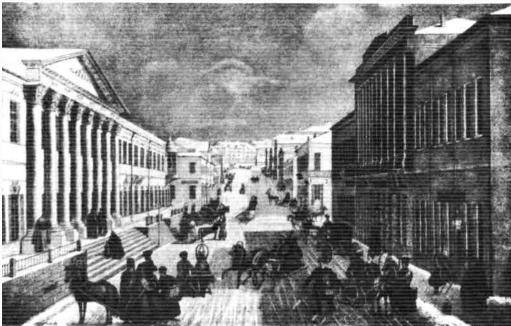
ВИД КУЗНЕЦКОГО МОСТА В МОСКВЕ. Литография. 1839.