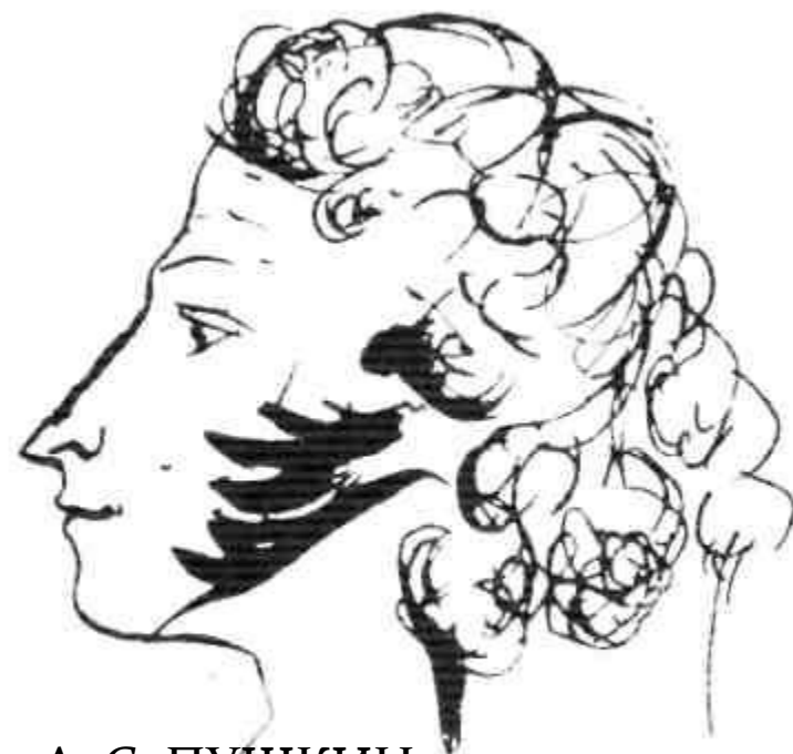
А. С. ПУШКИН. Автопортрет. 1829.