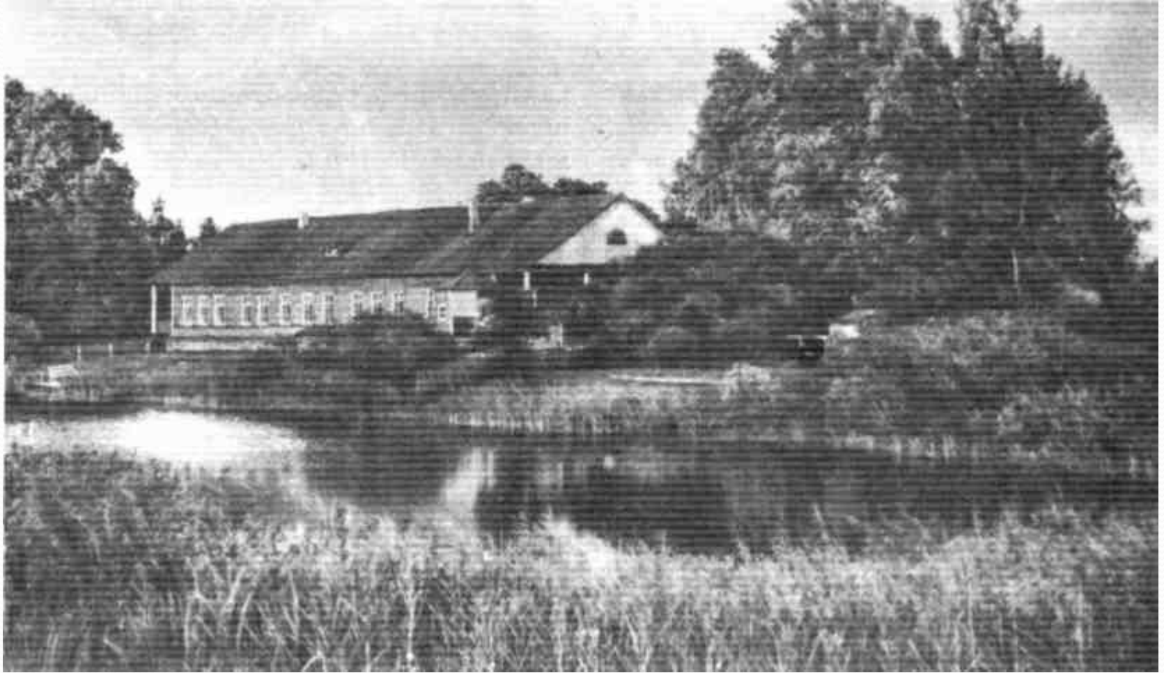
ТРИГОРСКОЕ. ДОМ ОСИПОВЫХ-ВУЛЬФ. Фотография. 1900-е годы.