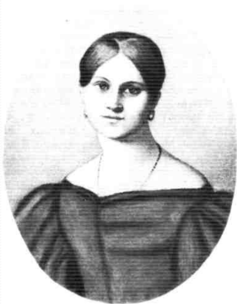
А. П. КЕРН. Миниатюра неизвестного художника. 1820-е годы.

Ранней весной 1819 года Анна Петровна приехала в Петербург и в доме ее родственников Олениных познакомилась с девятнадцатилетним Пушкиным. Юная красавица произвела на поэта неизгладимое впечатление. В стихотворении, посвященном Керн, отразилось это кратковременное знакомство и позднейшие их встречи.