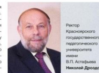
Ректор Красноярского государственного педагогического университета имени В.П. Астафьева Николай Дроздов

Человек сам создает эти проблемы. Но ему в то же время подвластно то, что неподвластно