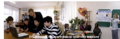
Студенты в педагогической практике в школе

Модернизация обучения начата, но обновления систем воспитания практически не происходит. На наш взгляд, это не соответствует высшему времени и должно быть кардинальным образом пересмотрено. XXI век, по многим причинам, становится веком «Всегообщего воспитания», точно так же, как прошедший XX век стал веком свершающегося «Всегообщего образования». Традиционный вопрос: «Чему учить новые поколения?» – заменяется новым, более адекватным и актуальным: «Как и для чего воспитывать грядущие поколения, чтобы они были готовы успешно жить и работать в изменяющемся мире?». Человеческий ресурс страны становится определяющим ресурсом будущего, превращается в наиболее востребованный капитал развития. ▶