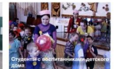
Студенты с волонтерским проектом детского дома