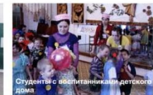
Студенты с семьей в детском доме