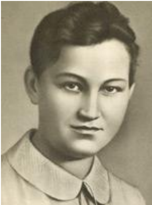
Зоя Космодемьянская, 18 лет