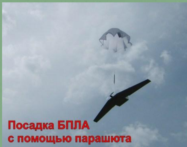
Посадка БПЛА с помощью парашюта