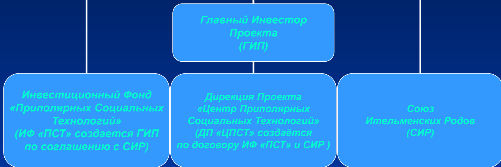
Схема взаимодействия Главного Инвестора и СИР при реализации Проекта