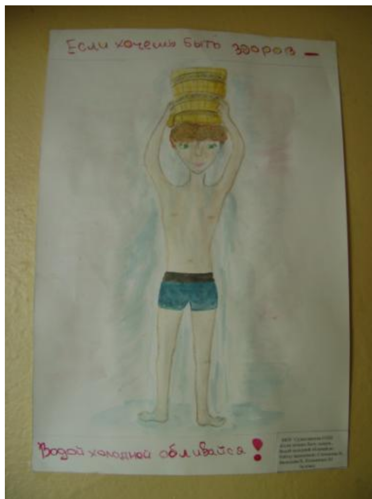
Автор эскиза Воробьёва Алина