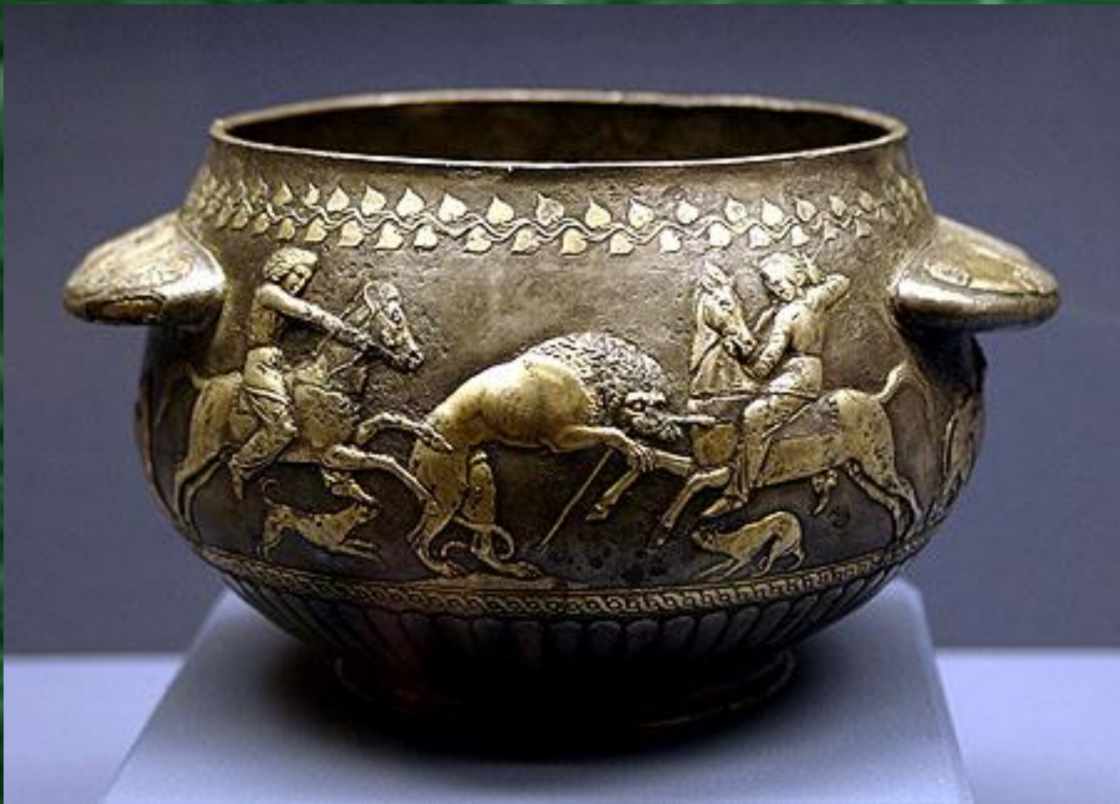
Скифское погребение, курган Солоха (б. Таврическая губерния). Раскопан в 1913 г. Н.И. Веселовским. Сосуд со сценой охоты. Серебро, позолота, 400 - 375 гг. до н.э.