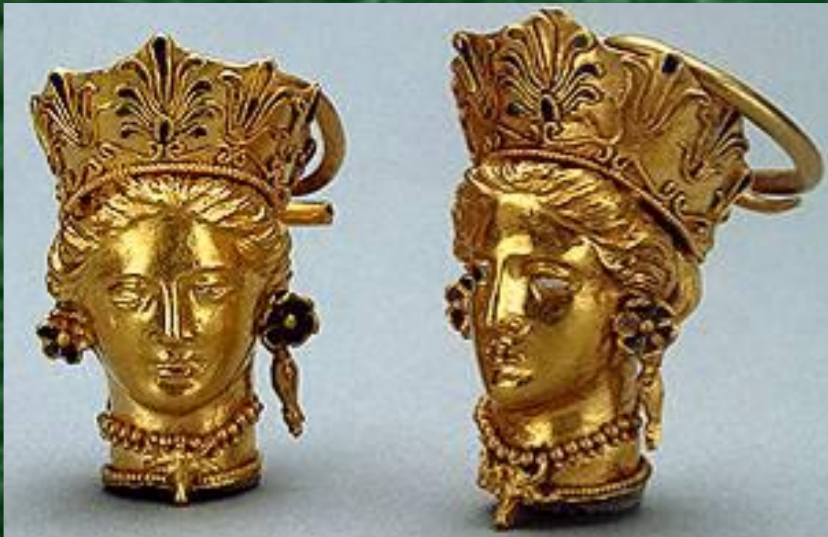
Пара серег с подвесками в виде женской головки Около 350 г. до н.э. Боспорское царство, Пантикапей. Каменная гробница, находка 1840 г. Керчь . Золото, эмаль; тиснение, чеканка, филигрань