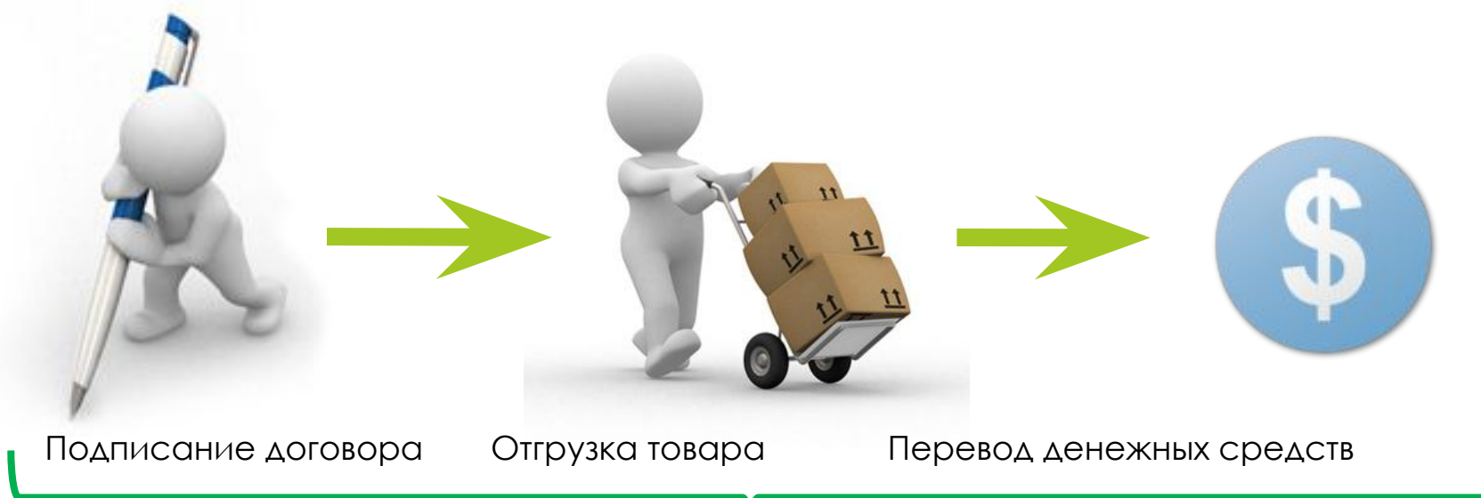
Схема №1. Отгрузка товара – перевод денежных средств