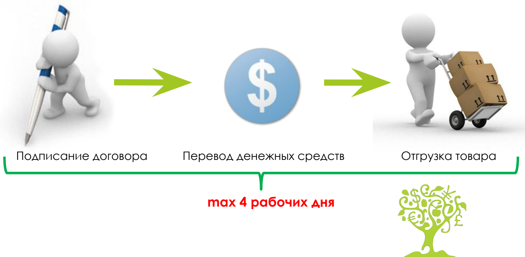
Схема №2. Перевод денежных средств – отгрузка товара