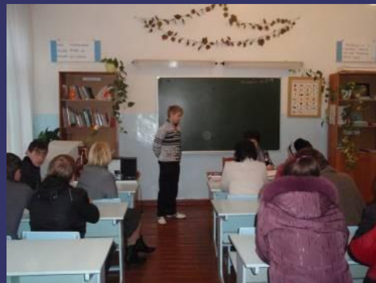
Совет по профилактике правонарушений