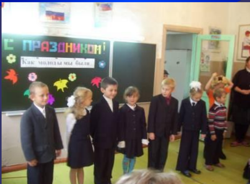
Дети поздравляют бабушек