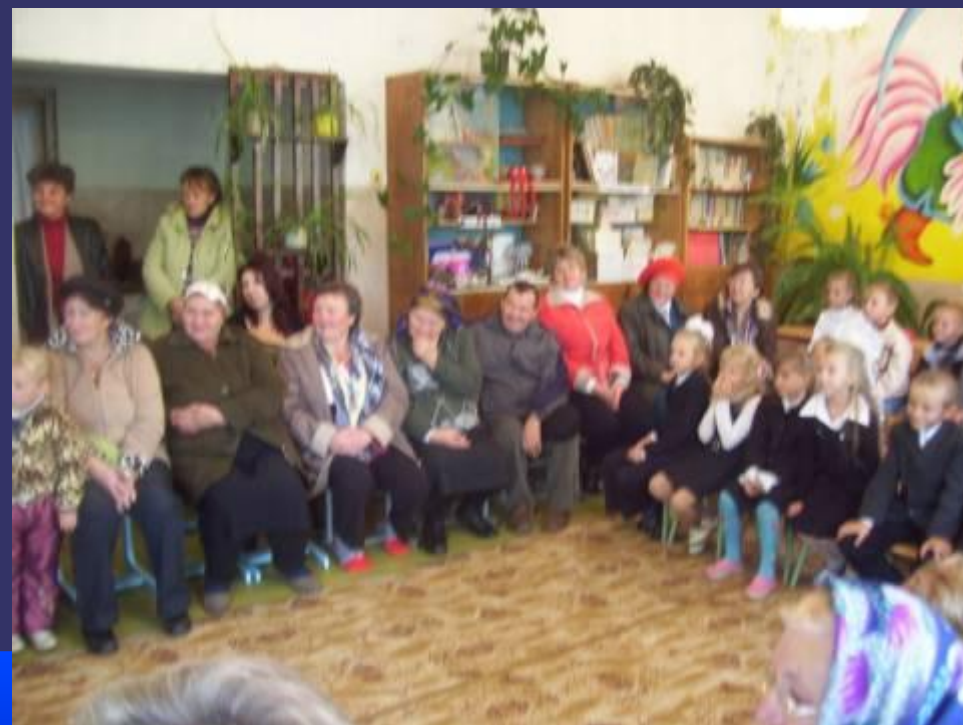
Бабушки - участники праздника