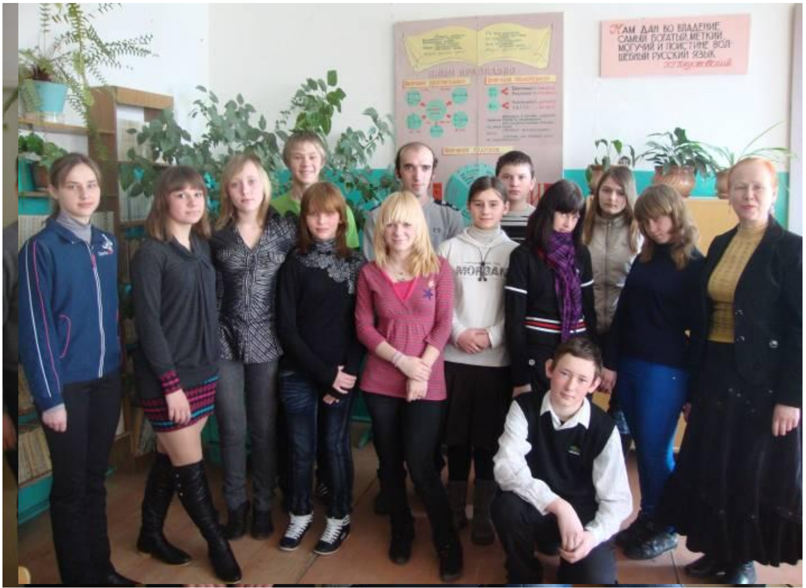
1. Встречи с членами районного литературного объединения «Ритм» и калужскими поэтами.