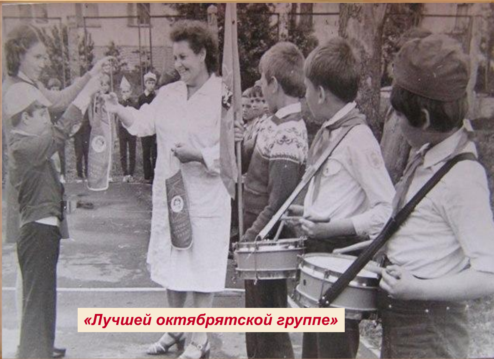
«Лучшей октябрятской группе»