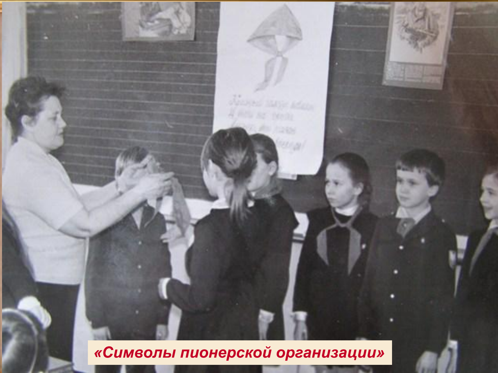
«Символы пионерской организации»