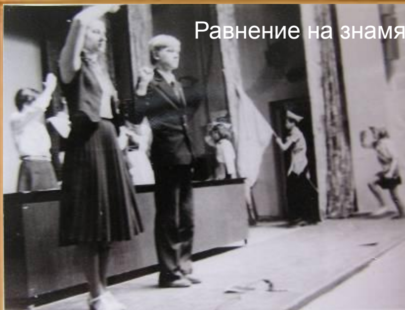
Равнение на знамя