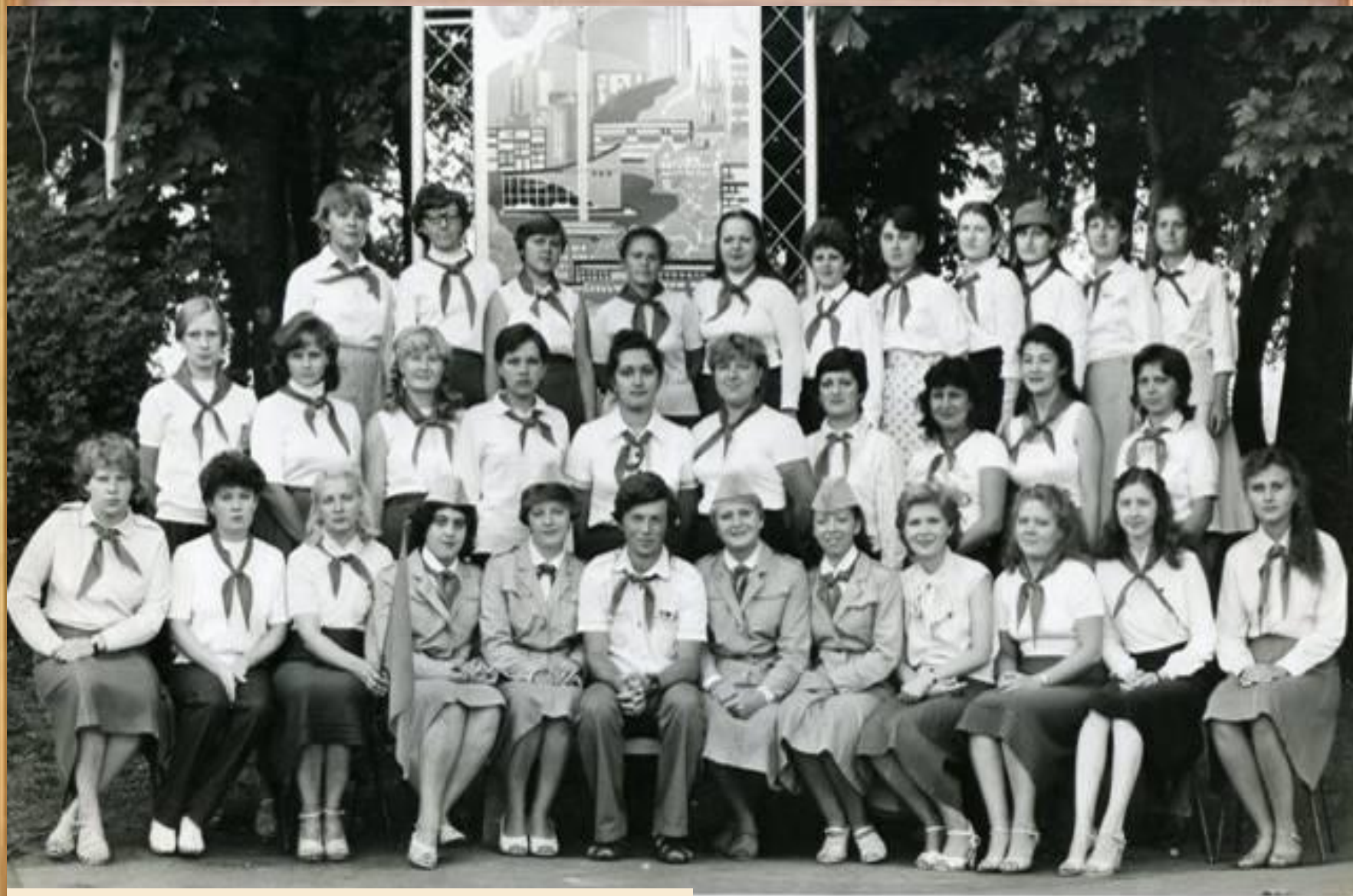
Старшие пионерские вожатые