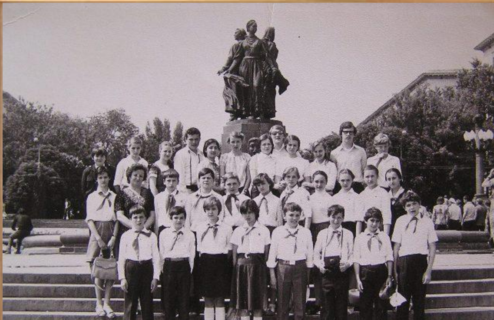
«Поездка на теплоходе пионерского актива в город Волгоград (пионерский фонд дружины)»