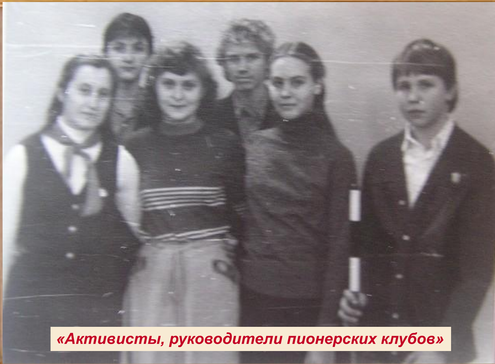
«Активисты, руководители пионерских клубов»