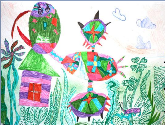
Лемешук Даниил, 6 лет