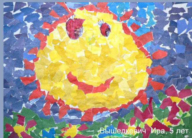
Вышедкевич Ира, 5 лет