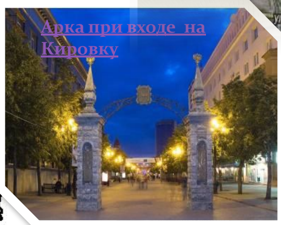
Арка при входе на Кировку