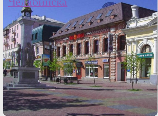
Памятник основателям Челябинска