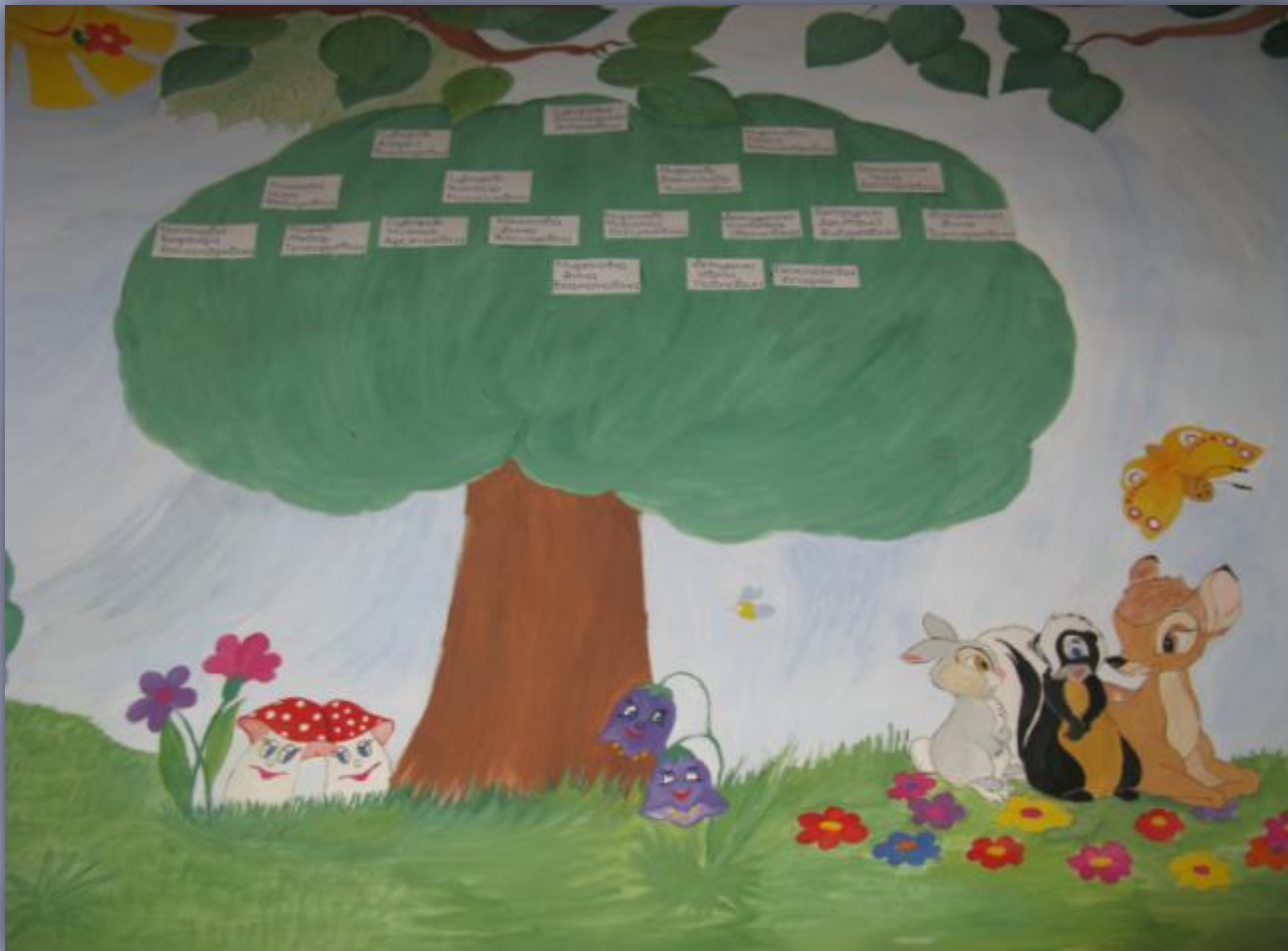
Родословное древо семьи Суворовых.