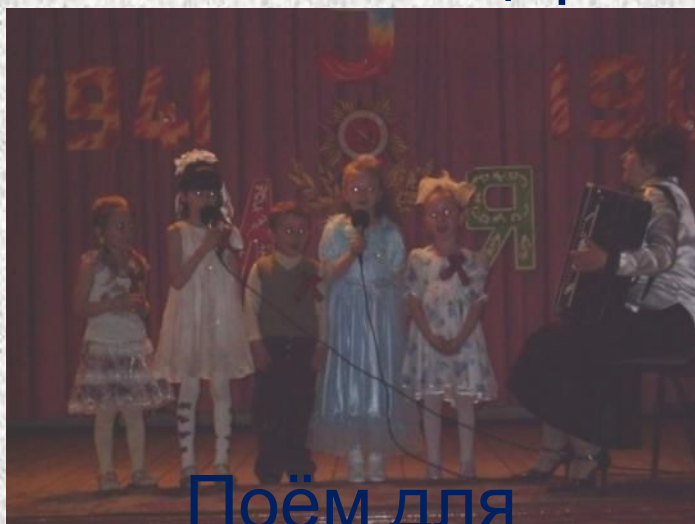
Поём для ветеранов