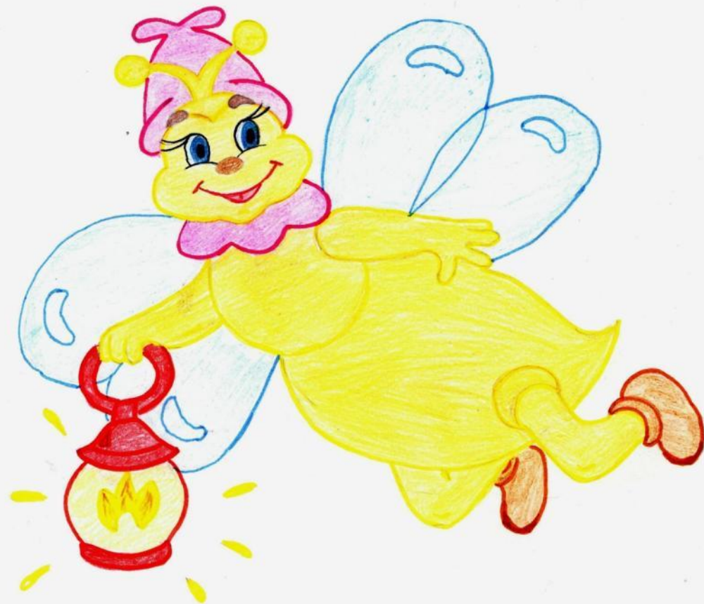
Эмблема Автор: Поручник А.В.

Добро пожаловать в Муниципально дошкольное образователь ное учреждение Детский сад № «Светлячок» с. Балахтон.