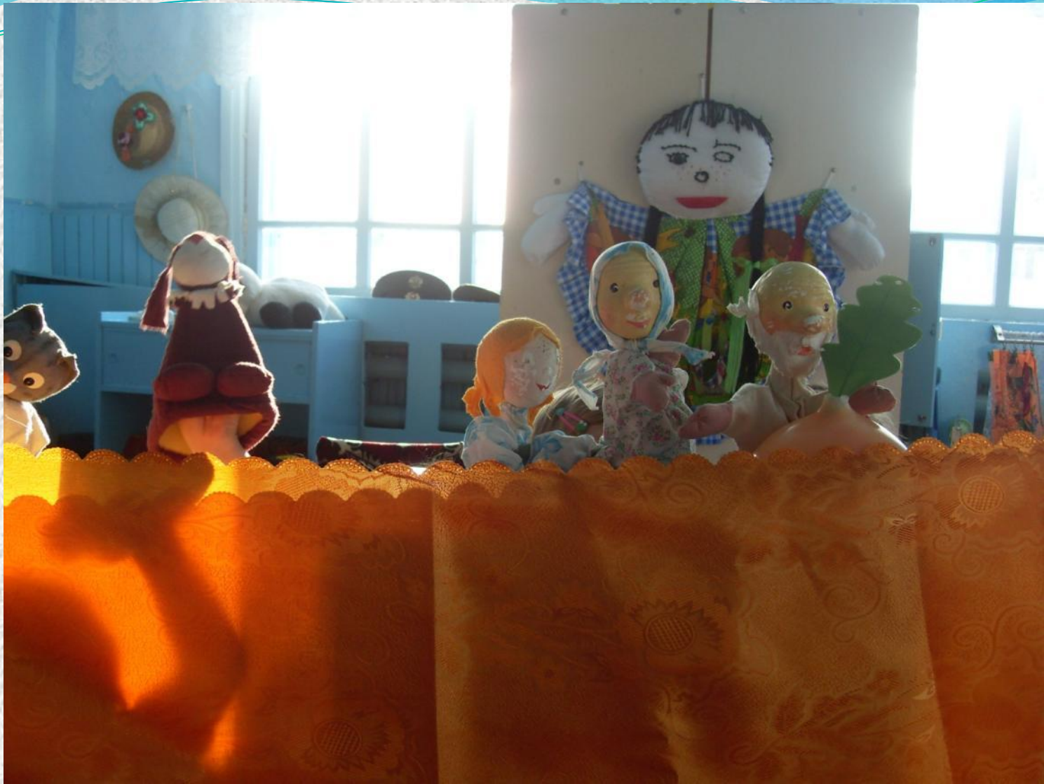
Театрализация сказки « Репка»