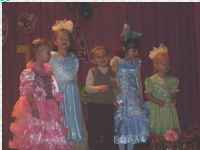
Концерт в СДК « Для милых мам»