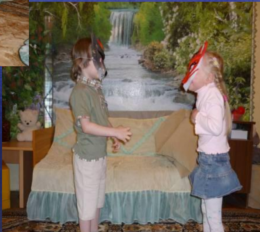
Фрагмент занятия по сказке «Волк и лиса»