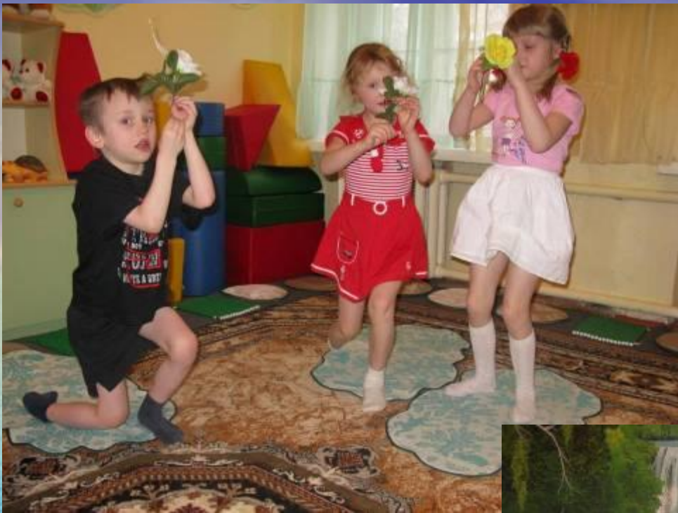
Фрагмент занятия по сказке «Дюймовочка»