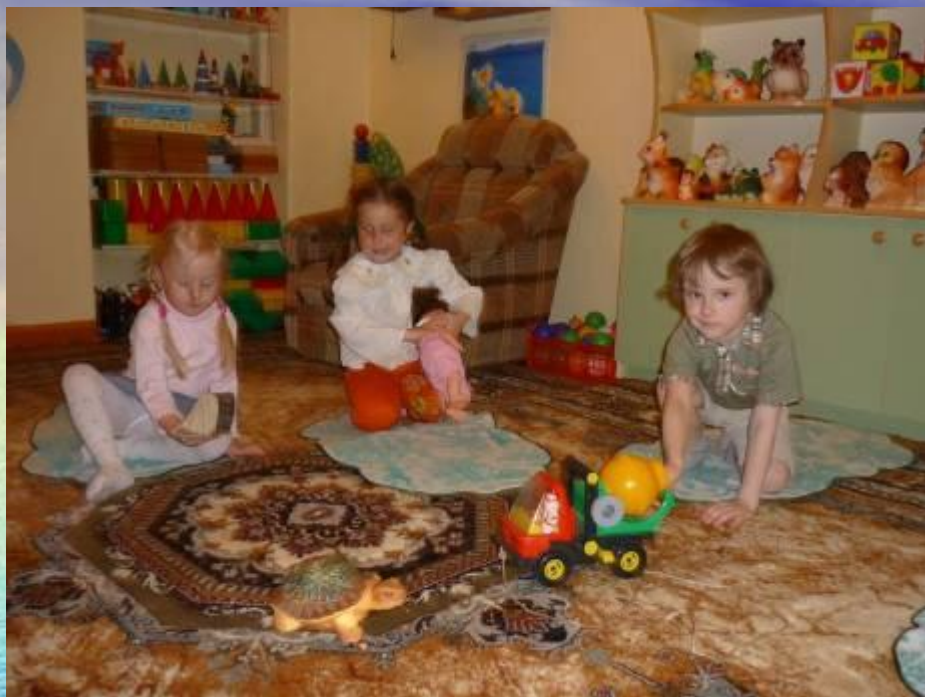
Фрагмент занятия по сказке «Русалочка»