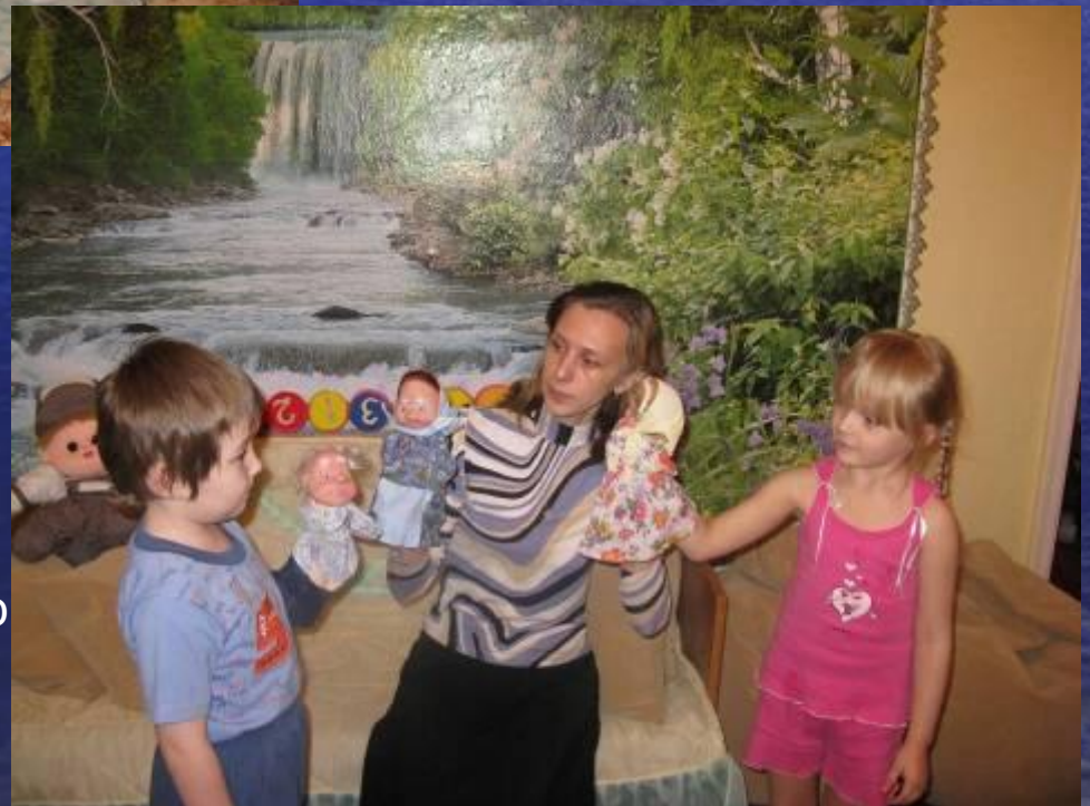
Фрагмент занятия по сказке «Снегурочка»