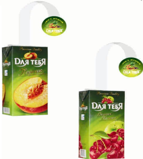
Открытка 297х90 мм, полноцвет, элитный белый картон, 1фальц