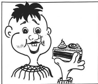
уплетать за обе щеки