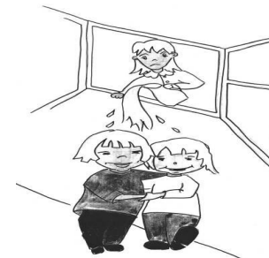
толочь воду в ступе