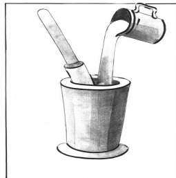
водой не разольешь