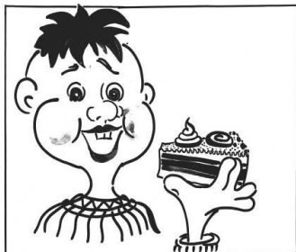
уплетать за обе щеки