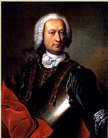
Отец, Жан-Батист Жозеф Франсуа граф де Сад, потомственный наместник в провинциях Брессе, Бюже, Вальроме и Же.