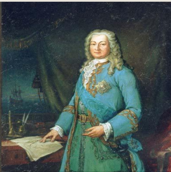
А. И. Остерман