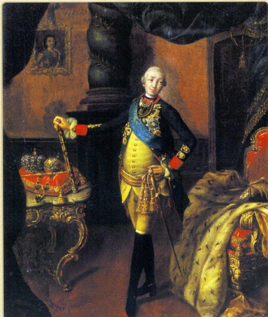
А. Антропов. «Портрет Петра III»

Петр III царствовал всего 186 дней. Отзывы о нем остались взаимоисключающие. В числе деяний Петра III было немало крупных государственных мер, вызвавших одобрительную реакцию при дворе и в армии. Но непредсказуемость императора, его пренебрежение русскими национальными и религиозными традициями сделали многих его противниками.