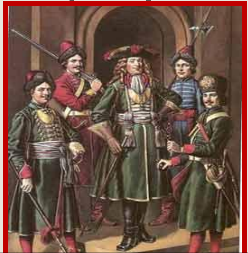
Летин "Служилое платье от Петра Великого. Гвардейские мундиры»