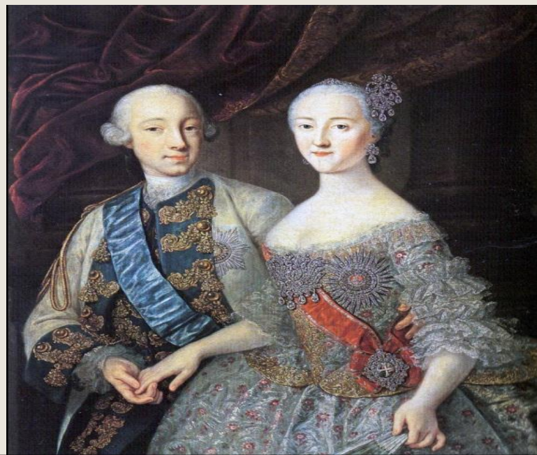
Г. Грот «Свадебный портрет»