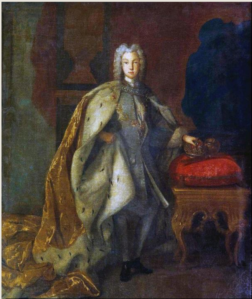
Прижизненный портрет работы Люддена ок 1728 г.

После смерти Екатерины I на престол 6 (17) мая 1727, вступил внук Петра I, сын царевича Алексея Петровича, последний представитель рода Романовых по прямой мужской линии Петр II . Ему было всего одиннадцать лет.