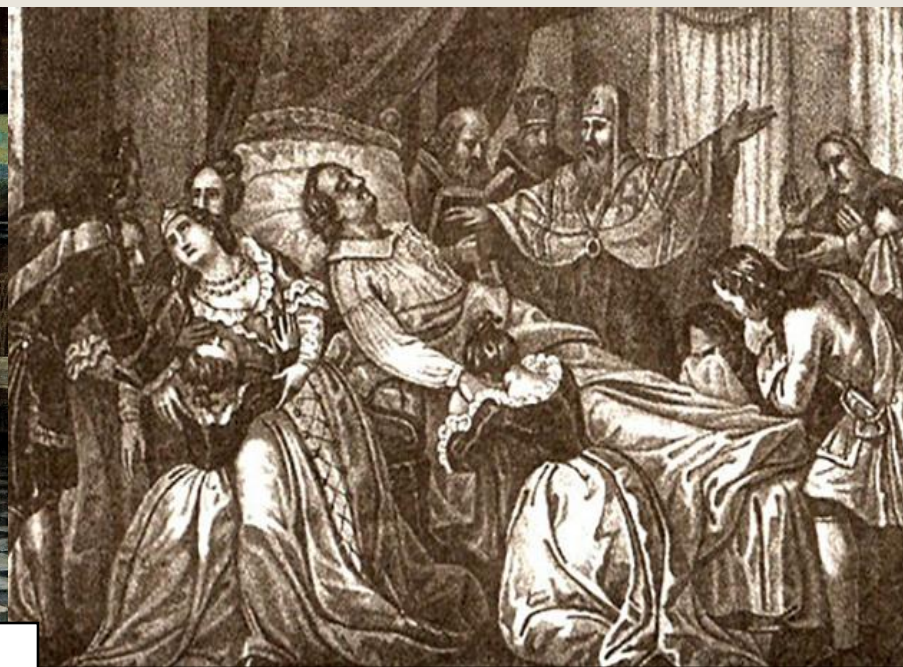
Гравюра "Смерть Петра Первого".