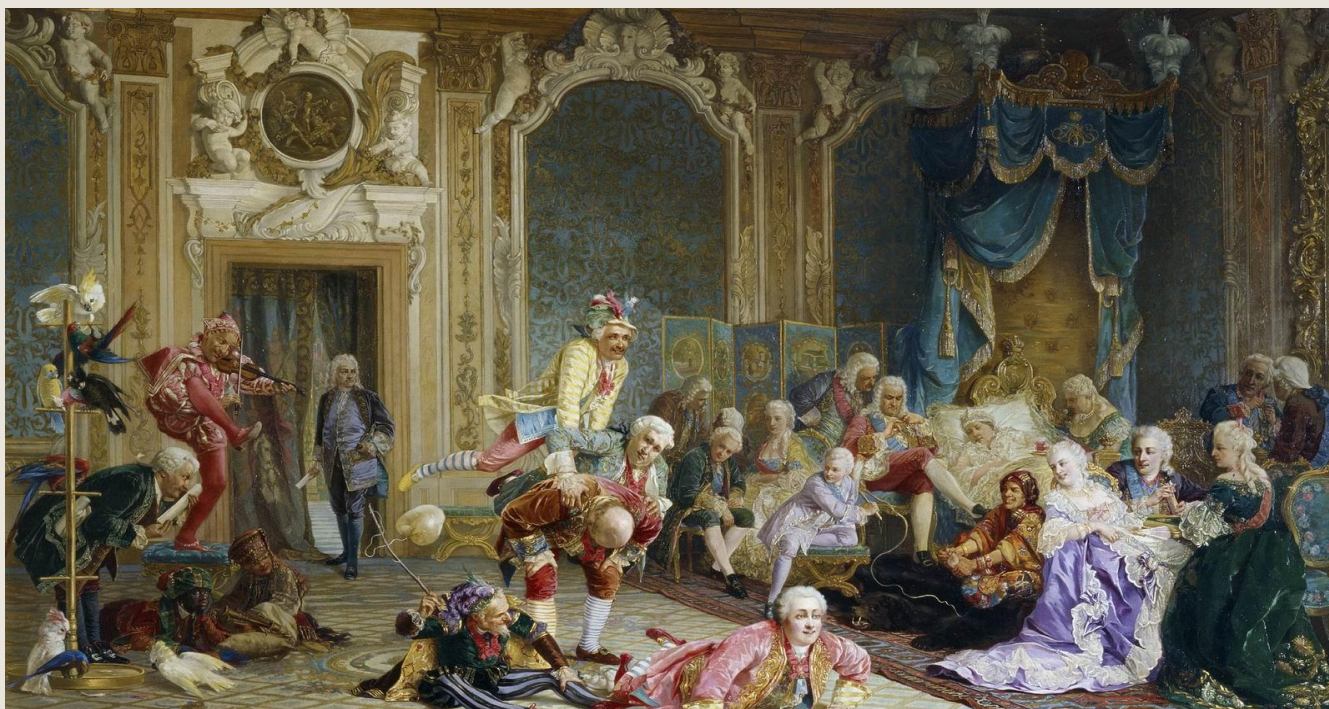
В. И. Якоби. «Шуты при дворе императрицы Анны Иоанновны» 1872.

«Немцы посыпались в Россию точно сор из дырявого мешка. Облепили двор, обсели престол, забирались во все доходные места в управлении". В.О. Ключевский . Процветали казнокрадство, фаворитизм, бессмысленные забавы