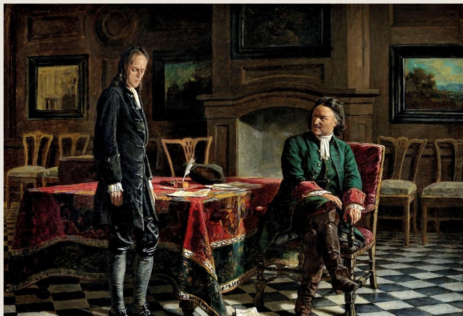
Н. Ге «Петр I допрашивает царевича Алексея»

Указ Петра I 1722 г. о престолонаследии, который оставлял за монархом право передавать российский трон тому, кого он сам выберет. Этот нормативный правовой акт стал причиной дворцовых переворотов в России, предельно расширив круг возможных претендентов на престол. Указ действовал до 1797 г.