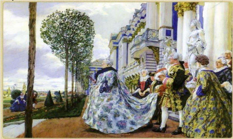
Е Лансере «Императрица Елизавета Петровна в Царском Селе»

Вскоре, однако, Елизавета разочаровалась в племяннике. Он так и остался немецким принцем, равнодушным к России, боготворившим лишь прусского короля. После рождения у Петра и Екатерины в 1754 году сына Павла императрица взяла мальчика на собственное воспитание и стала задумываться о передаче ему прав на престол. В декабре 1761 года Елизавета умерла.