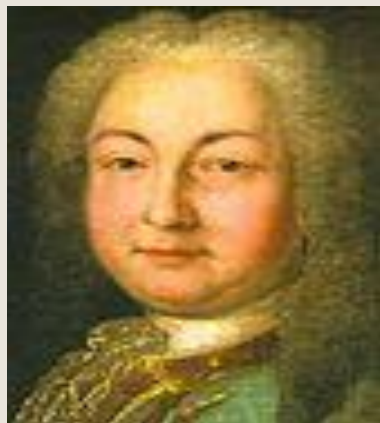
А. И. Остерман