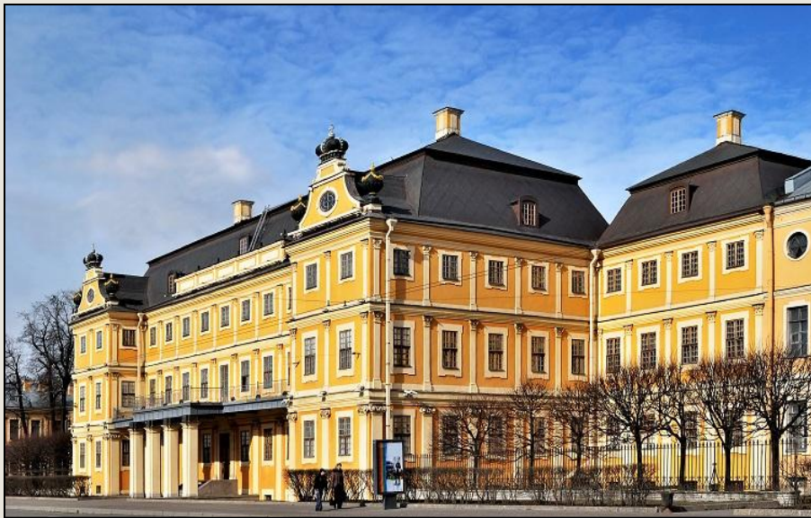
Меншиковский Дворец в Санкт-Петербурге

Меншиков написал прошение об отставке. Петр II тут же подписал указ, а заодно поручил специальной комиссии расследовать коммерческие дела светлейшего. Комиссия нашла множество злоупотреблений, и Меншиков был лишен всего имущества и вместе с семьей отправлен в ссылку в сибирский городок Березов.