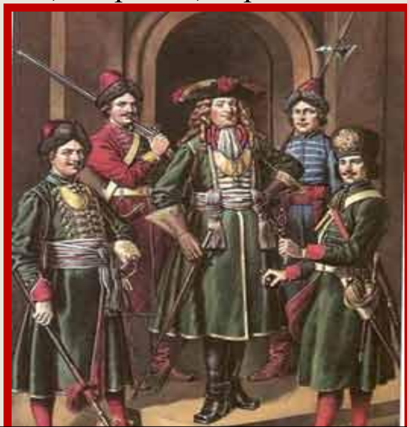
Летин "Служилое платье от Петра Великого. Гвардейские мундиры»