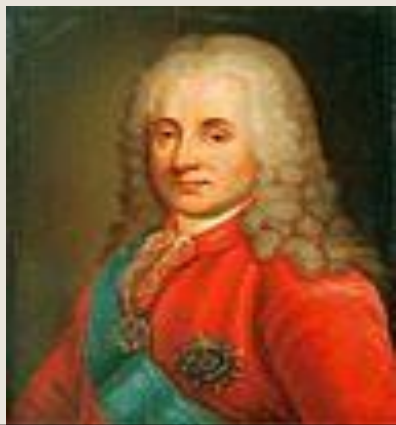
Д. М. Голицын