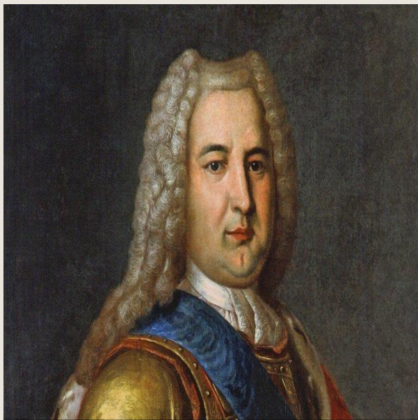
Э. И. Бирон

Вместе с Анной из Курляндии прибыли многие прибалтийские немцы, занявшие ключевые позиции в органах государственного управления. Ее фаворит Э. И. Бирон, стал первым министром. Видные позиции при дворе занимал и вице-канцлер А. И. Остерман, глава военной коллегии Б. К. Миних.