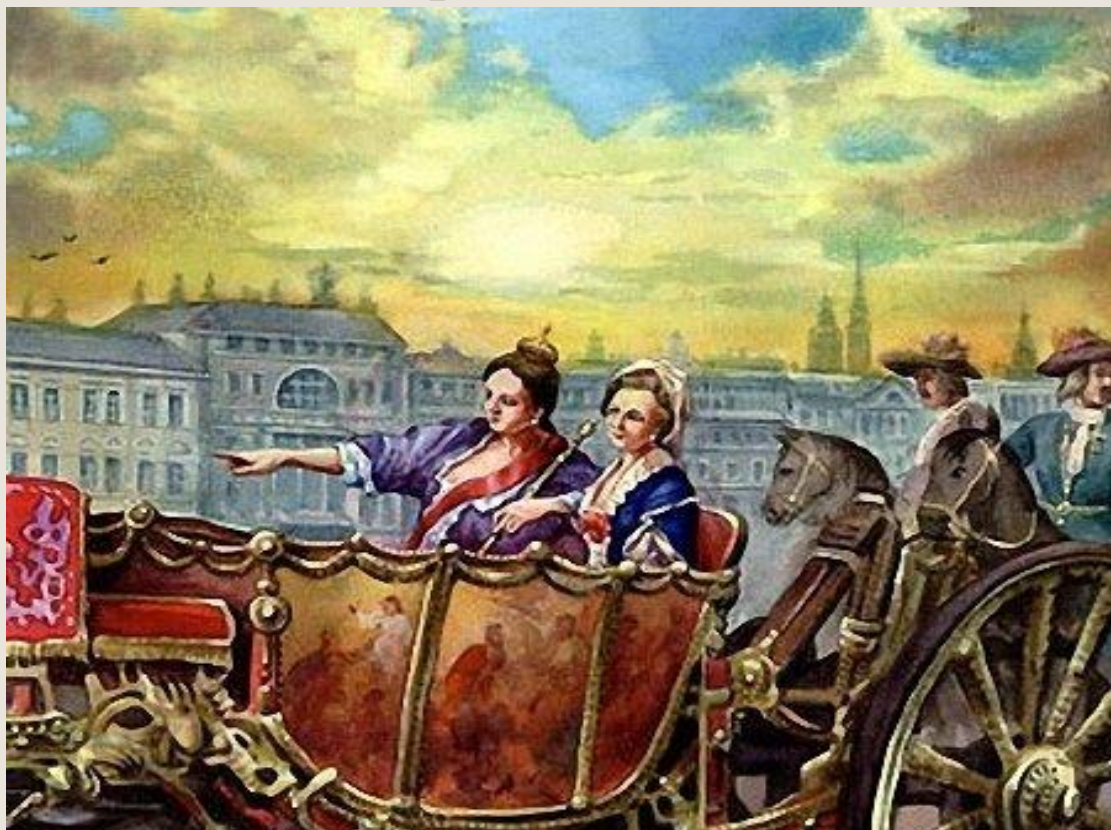
Неизвестный художник. «Анна Иоанновна и Анна Леопольдовна на прогулке».

Желая закрепить власть за потомками царя Ивана Алексеевича Анна Иоанновна приблизила ко двору племянницу Анну Леопольдовну, которая стала главной кандидаткой на престол. Родня Петра I была удалена от двора.