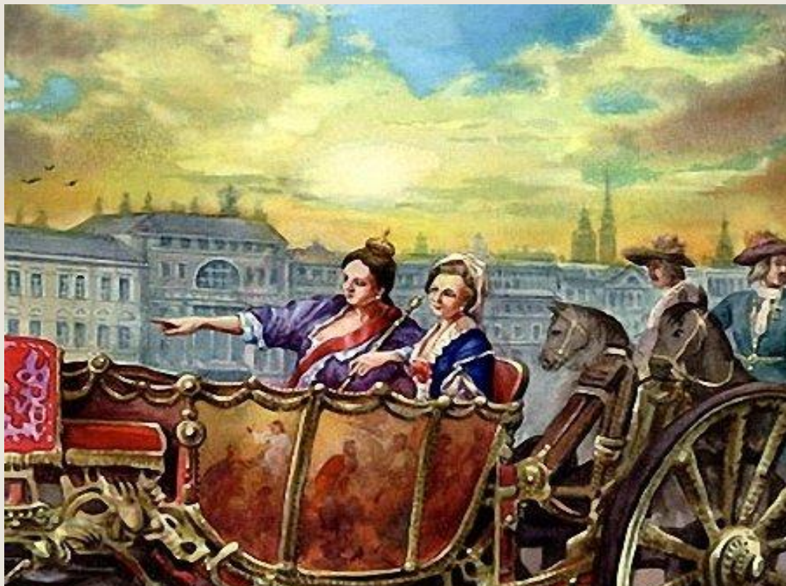
Неизвестный художник. «Анна Иоанновна и Анна Леопольдовна на прогулке».

Желая закрепить власть за потомками царя Ивана Алексеевича Анна Иоанновна приблизила ко двору племянницу Анну Леопольдовну, которая стала главной кандидаткой на престол. Родня Петра I была удалена от двора.