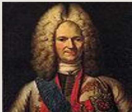
А. Д. Меншиков