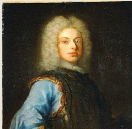
Карл Фридрих Гольштейнский