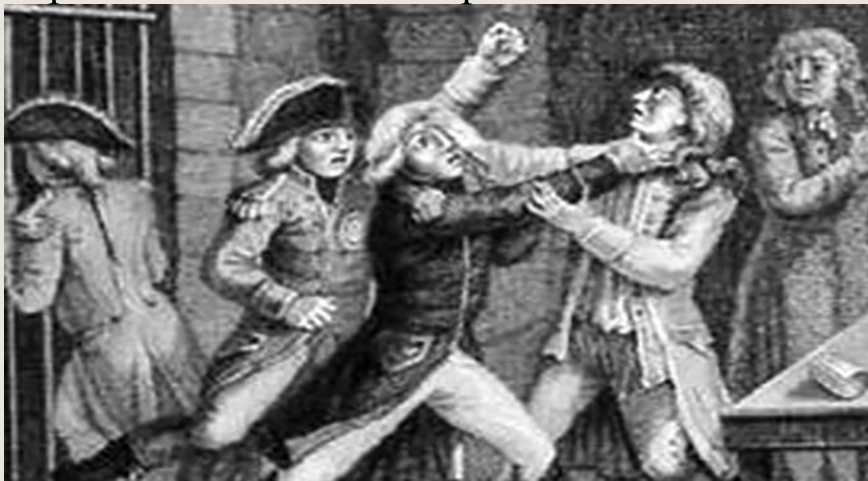
Убийство Петра III. Гравюра

28 июня 1762 года Петр III был свергнут и арестован, а через неделю убит в пьяной драке А. Г. Орловым. Это был пятый дворцовый переворот с момента смерти Петра Великого. На престол на долгие 34 года вступила Екатерина II , вошедшая в историю России как Екатерина Великая