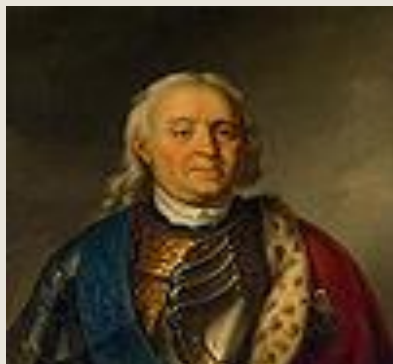
Ф. М. Апраксин