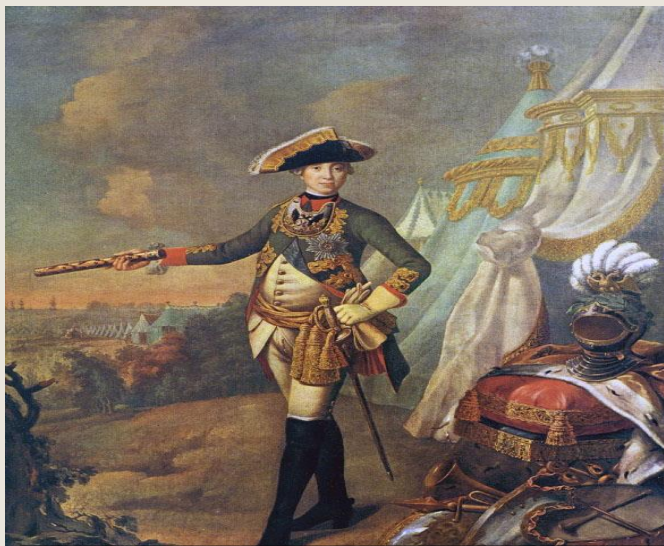
А. Антропов. «Портрет Петра III»

В 1742 году она назначила преемником своего племянника Петра Федоровича — сына Анны Петровны, внука Петра I. Ему едва исполнилось к тому времени 14 лет. Вскоре императрица женила его на немецкой принцессе Софии Августе Фредерике Ангальт-Цербстской, которая после крещения по православному обряду получила новое имя — Екатерина