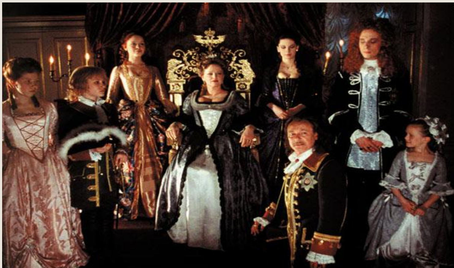
Кадр фильма «Тайны дворцовых переворотов»

Дворцовый переворот - смена власти, совершавшаяся дворянскими группировками при поддержке гвардейских ПОЛКОВ.