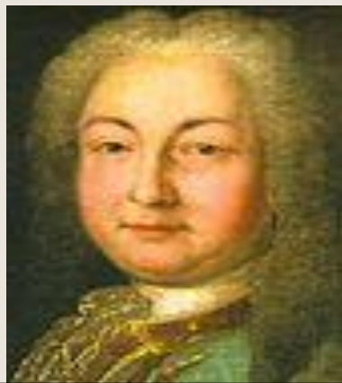
А. И. Остерман