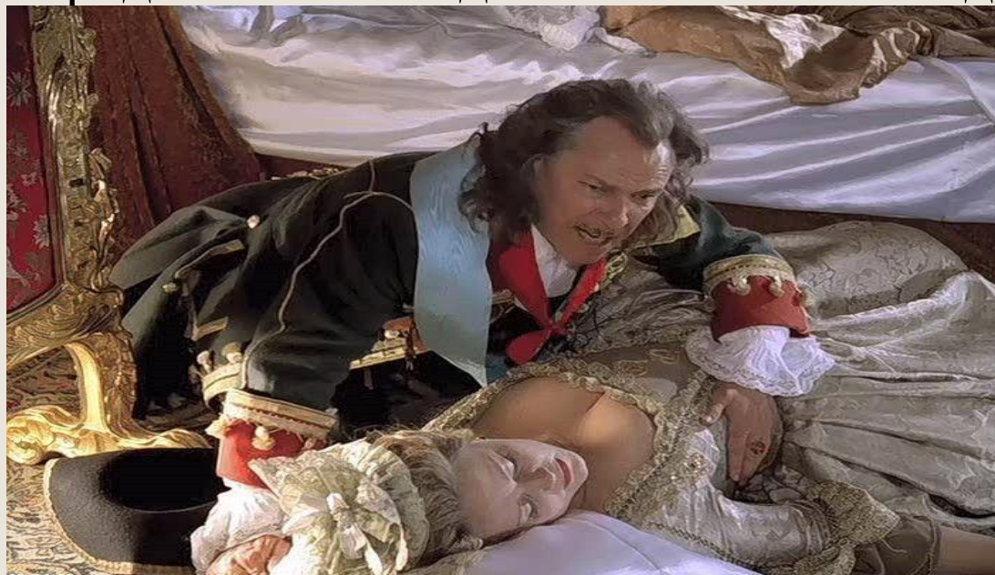
Кадр фильма «Тайны дворцовых переворотов»

Для примирения враждующих дворцовых партий был создан Верховный тайный совет , в состав которого вошли как представители старой знати, так и «птенцов гнезда Петрова». Ключевые позиции в нем имел Меншиков, который являлся фактическим правителем страны. Однако царствование Екатерины продолжалось недолго. В мае 1727 года она умерла.