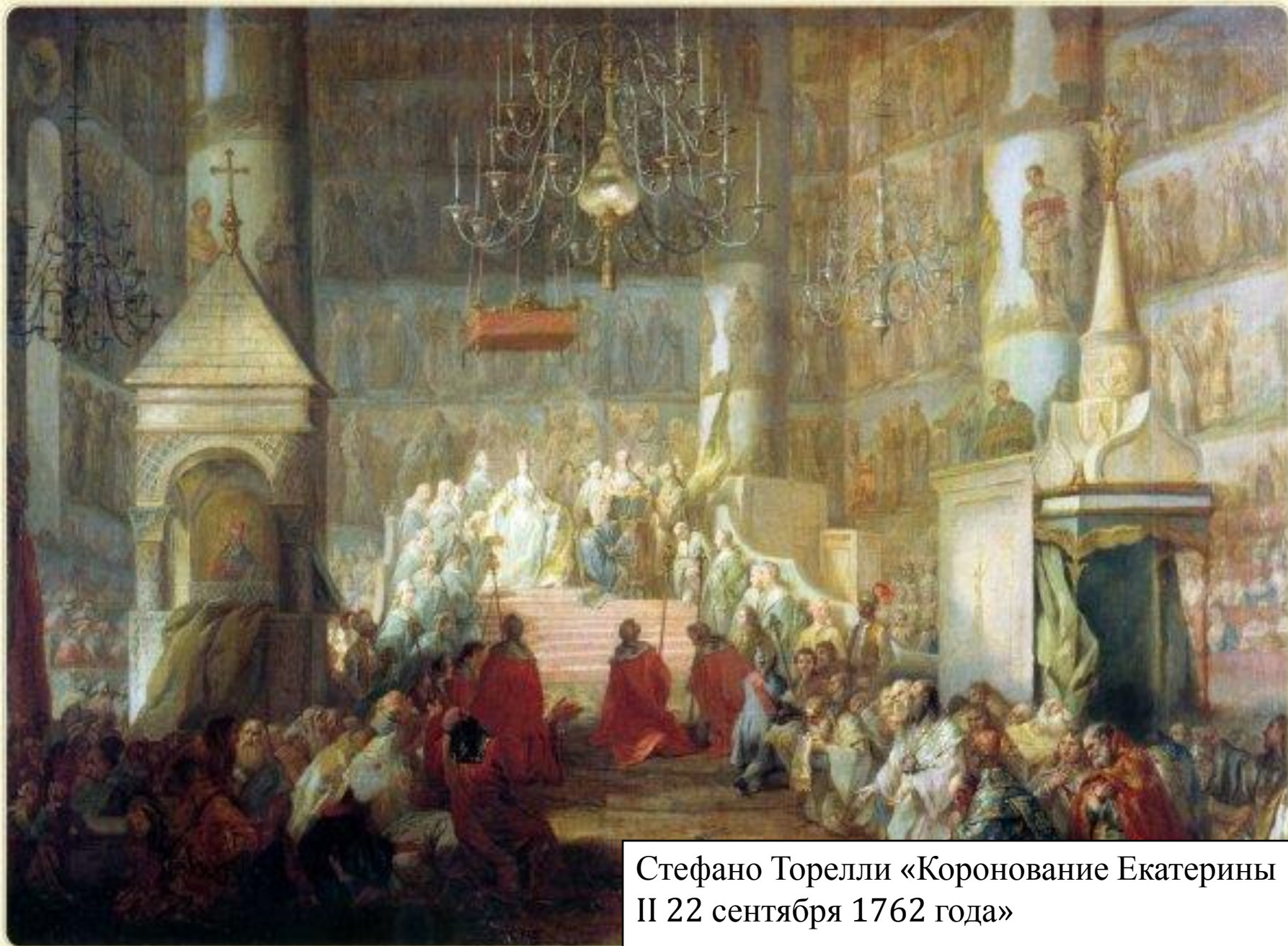
Стефано Торелли «Коронование Екатерины II 22 сентября 1762 года»