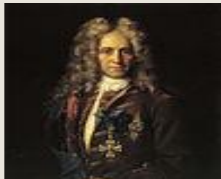
Г. И. Головкин