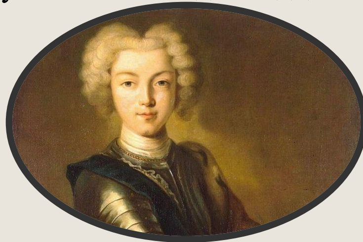
Портрет Петра Алексеевича II, внука Петра I — И. Ведикинд.

После смерти Екатерины I на престол 6 (17) мая 1727, вступил внук Петра I, сын царевича Алексея Петровича, последний представитель рода Романовых по прямой мужской линии Петр II . Ему было всего одиннадцать лет.