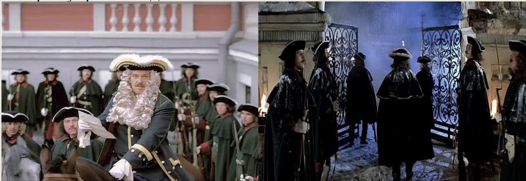
КадрЫ фильма «Тайны дворцовых переворотов»

С.Ф. Платонов в лекциях по русской истории отмечал: «Россия пережила несколько дворцовых переворотов; у власти стояли иногда люди, чуждые стране, по своим эгоистическим склонностям не достойные власти. Причины, обусловившие эту эпоху переворотов и временщиков, коренились, с одной стороны в состоянии царской семьи, а с другой – в особенностях той среды, которая управляла делами.»