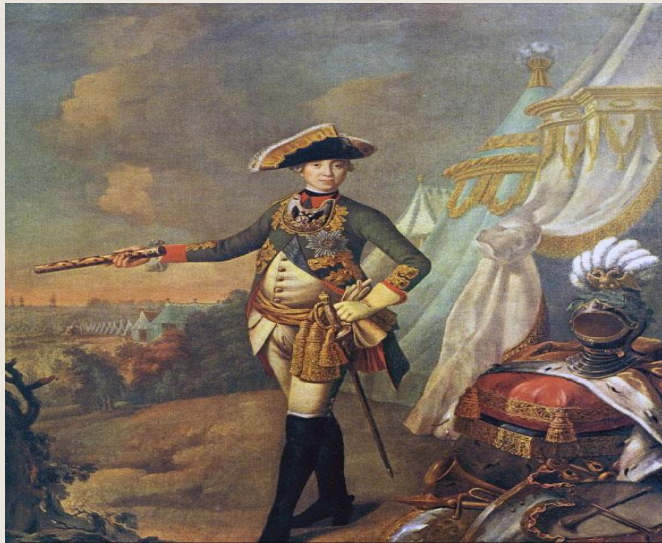
А. Антропов. «Портрет Петра III»

В 1742 году она назначила преемником своего племянника Петра Федоровича — сына Анны Петровны, внука Петра I. Ему едва исполнилось к тому времени 14 лет. Вскоре императрица женила его на немецкой принцессе Софии Августе Фредерике Ангальт-Цербстской, которая после крещения по православному обряду получила новое имя — Екатерина