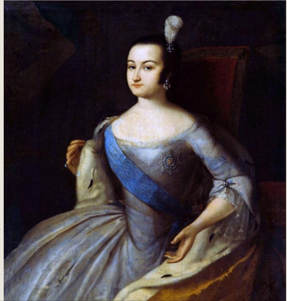
Прижизненный портрет (предположительно работы Каравака.)

Маленькому Ивану было два месяца, когда он был объявлен императором. Вся реальная власть сосредоточилась в руках Бирона, издававшего от имени маленького монарха указы. Заговор против временщика возглавил фельдмаршал Б. К. Миних. 9 ноября 1740 года он во главе гвардейского отряда арестовал Бирона и провозгласил регентшей при малолетнем императоре его мать Анну Леопольдовну .