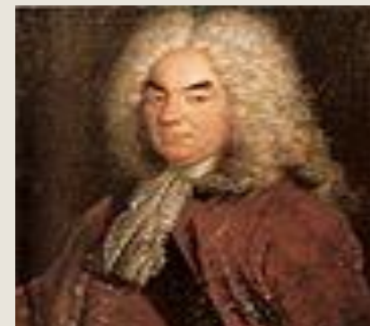
П. А. Толстой