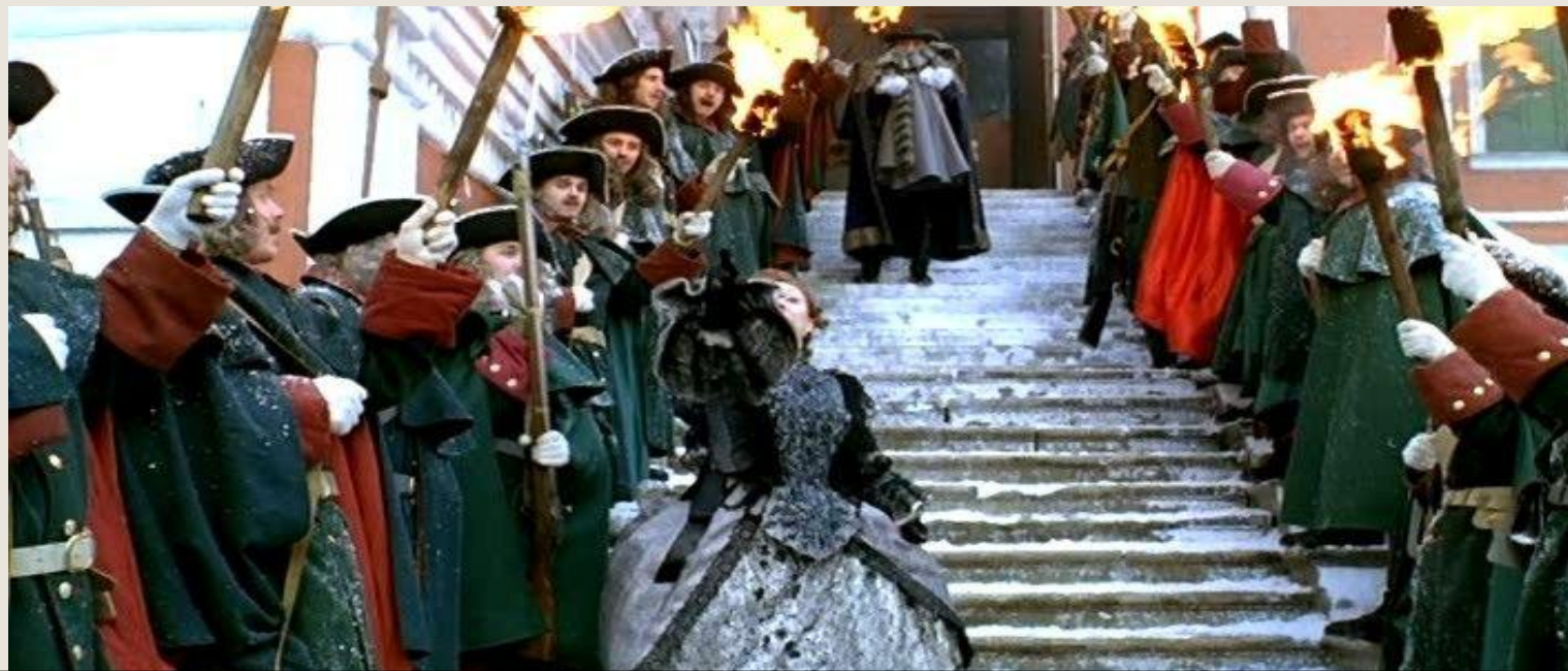
Кадр фильма «Тайны дворцовых переворотов»

Но приехав в Москву Анна, опираясь на гвардейские полки разорвала Кондиции. Верховный тайный совет был упразднен. Так, при помощи гвардии произошел второй дворцовый переворот, приведший Анну на русский престол на целых десять лет. Правление же «верховников» продлилось 37 дней.