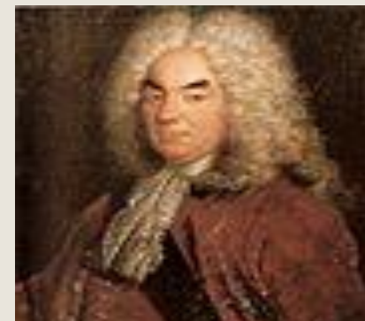
П. А. Толстой