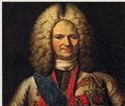
А. Д. Меншиков