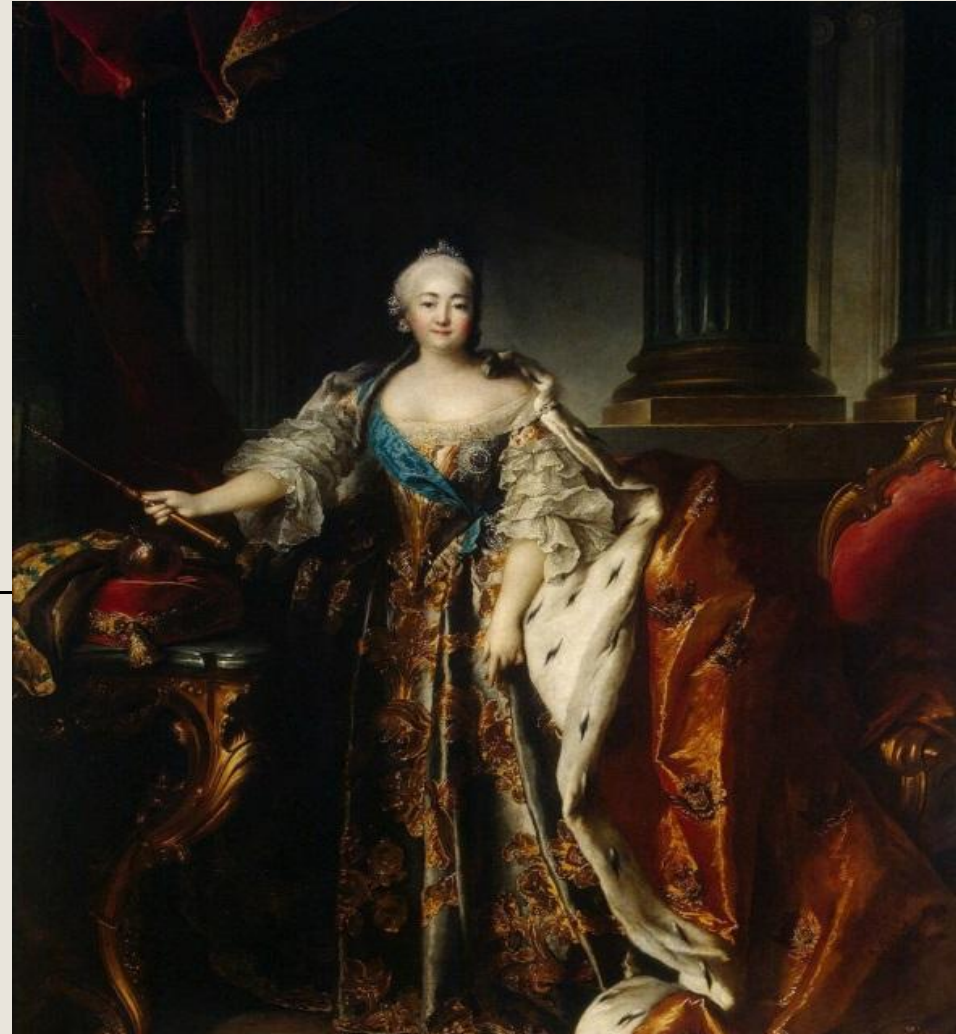
Ж. Токе 1758 г. Портрет Елизаветы Петровны

В Елизавете сочеталась страсть к нарядам, развлечениям, танцам с набожностью, строгими постами и богомольями. Государством Елизавета управляла через своих фаворитов и доверенных лиц — Шувалова, А.П. Бестужева-Рюмина, М. И. Воронцова.