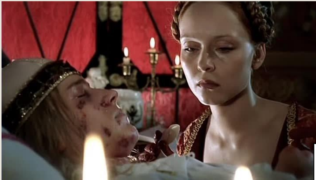
Кадр фильма «Тайны дворцовых переворотов»

Страной от имени Петра II открыто правили Долгорукие, предлагая ему охоты, балы и пирушки. Из 21 месяца (с февраля 1728 по ноябрь 1729 года) 8 месяцев он провел в выездах на охоту. В 1730 году должна была состояться свадьба Петра II. Однако на очередной охоте царь простудился и умер как раз в тот день, когда должна была состояться его свадьба.