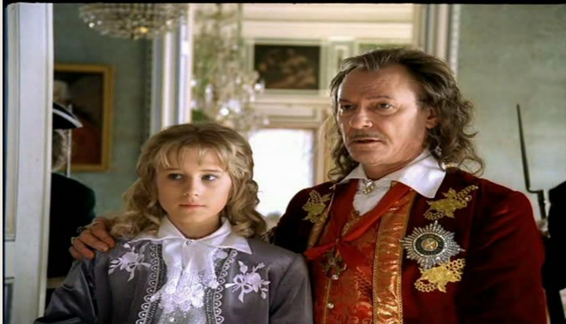
Кадр фильма «Тайны дворцовых переворотов»

Меншиков рассчитывал выдать за Петра II свою дочь Марию и породниться с царским домом. Но при Петра II усилились позиции старой родовой знати — Долгоруких, Голицыных, Лопухиных. Император почти не общался с Меншиковым, проводя все свободное время со сверстником-фаворитом Иваном Долгоруким.