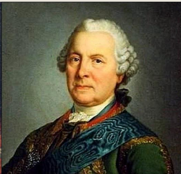
Б. К. Миних.