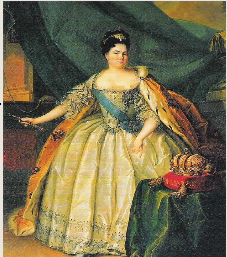
Екатерина I Алексеевна. Неизвестный художник XVIII в.