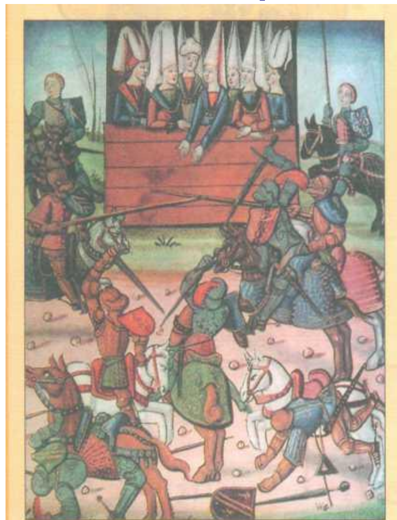
«Рыцарский турнир». Книжная миниатюра. Вторая половина XV в.