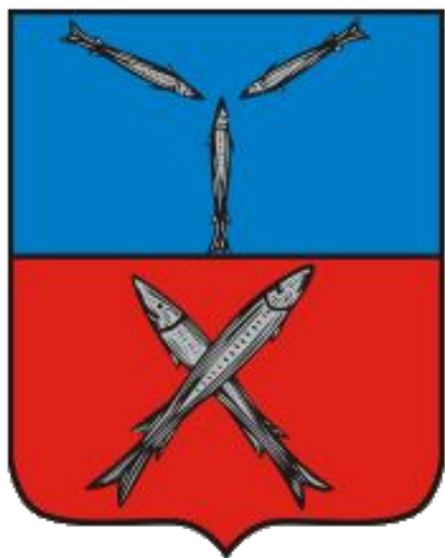
Герб г. Царицын

У городов и областей так же есть свои гербы: