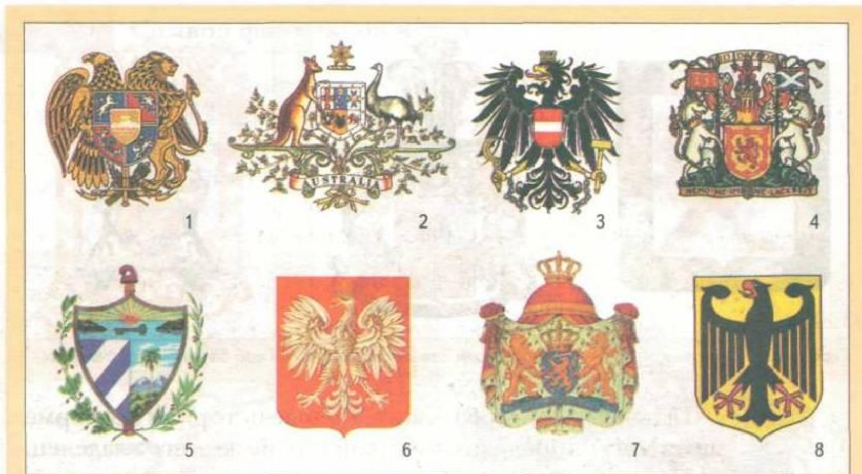
Изображения гербов иностранных государств: 1 — Армении; 2 — Австралии; 3 — Австрии; 4 — Шотландии; 5 — Кубы; 6 — Польши; 7 — Нидерландов; 8 — Германии