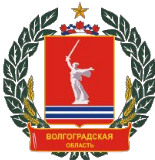
Герб Волгоградской области