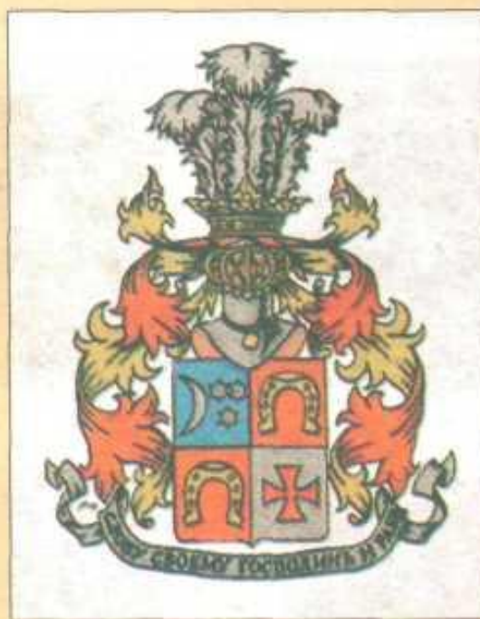
Герб дворян Звениговцевых