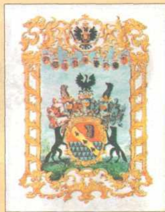
Герб баронов Строгановых