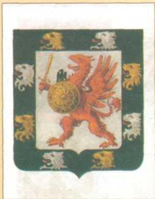
Герб рода Романовых