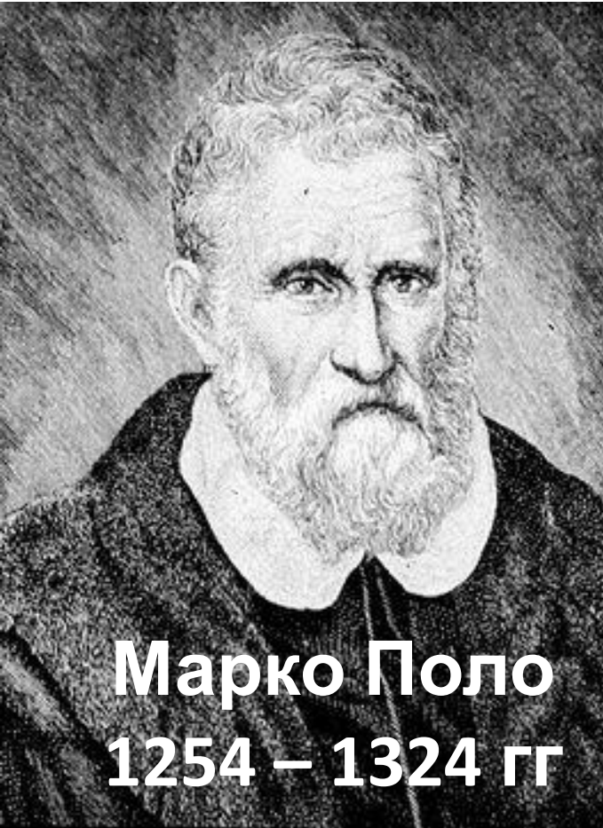
Марко Поло 1254 – 1324 гг