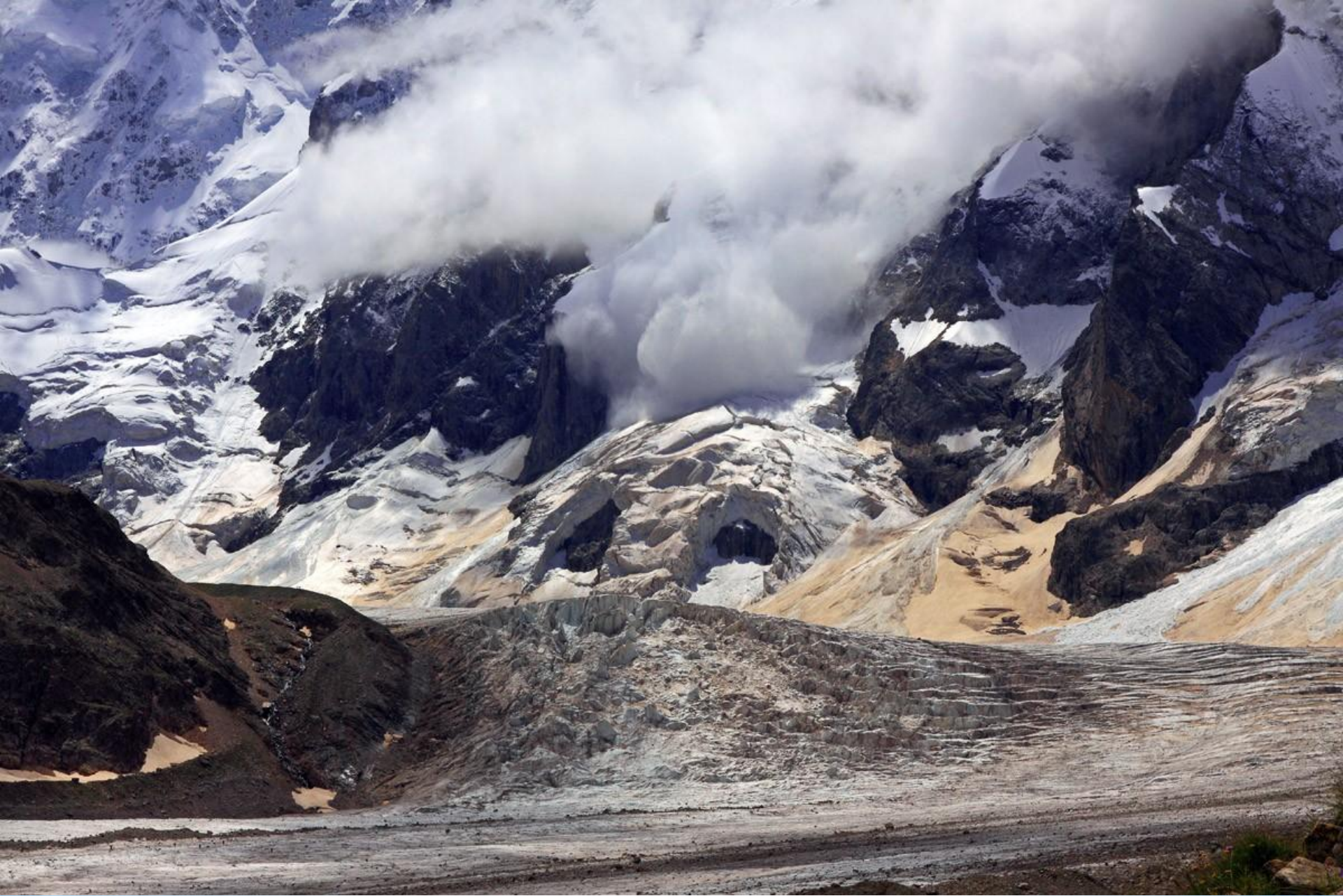
Лавина, Безенги, Кавказ, горы, ледник, скала.