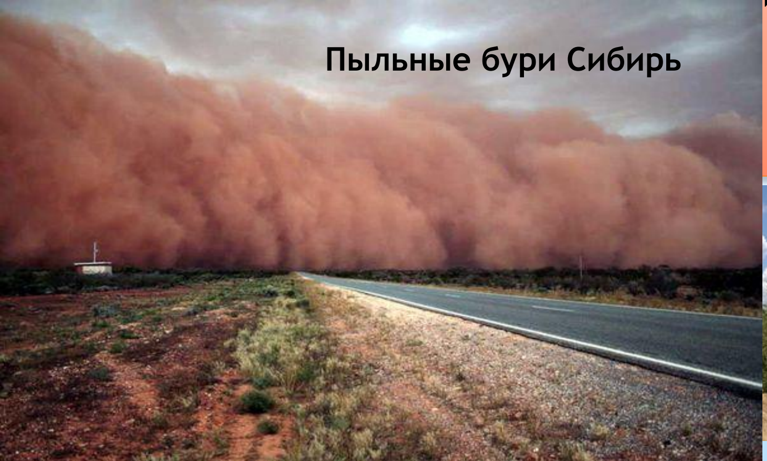
Пыльные бури Сибирь